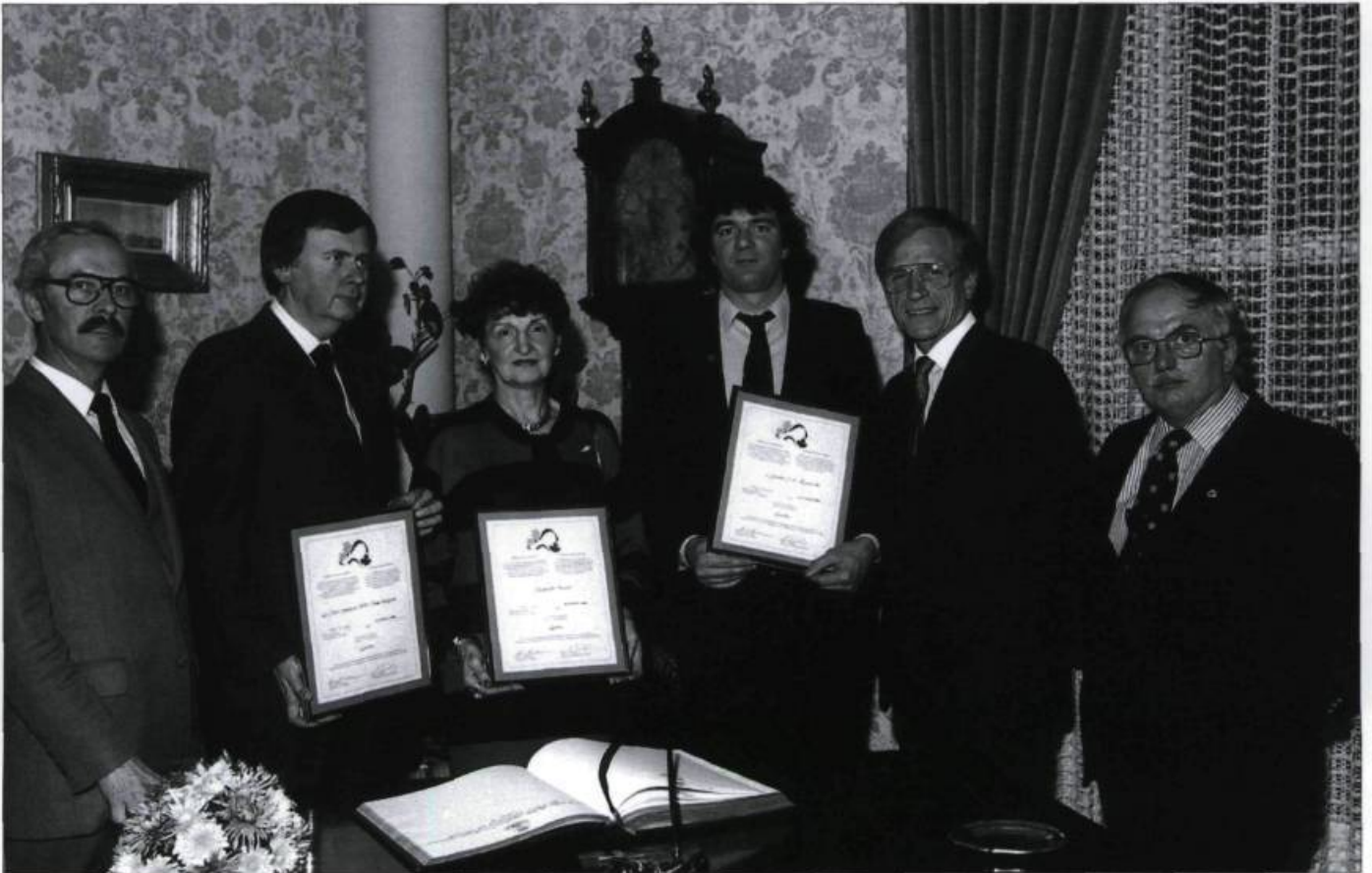
Remise du titre «Les amis du patrimoine» à l'équipe de la Caisse par la Ville de Québec, en octobre 1985.