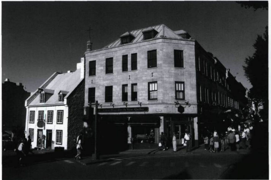
L'édifice de la Caisse populaire à l'angle de la rue des Jardins et Sainte-Anne, en plein cœur du Vieux-Québec touristique.

D.B. : Une caisse populaire, c'est d'abord et avant tout les membres qui la composent. Cela nous amène à dire, en ce qui concerne les nouvelles technologies ou les nouveaux modes de distri-