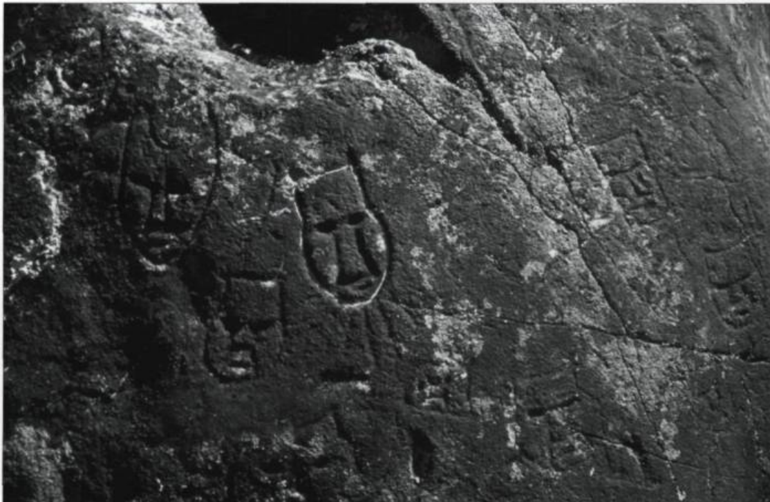
Pétroglyphes sur l'île Qajartalik, région de Kangirsujuaq, 1996. Site Jhev-1.