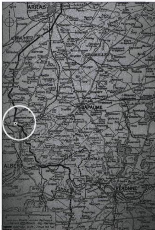
La bataille d'Albert. Patrouille avançant vers les tranchées allemandes lors de l'attaque de Beaumont-Hamel, le 1 er juillet 1916.