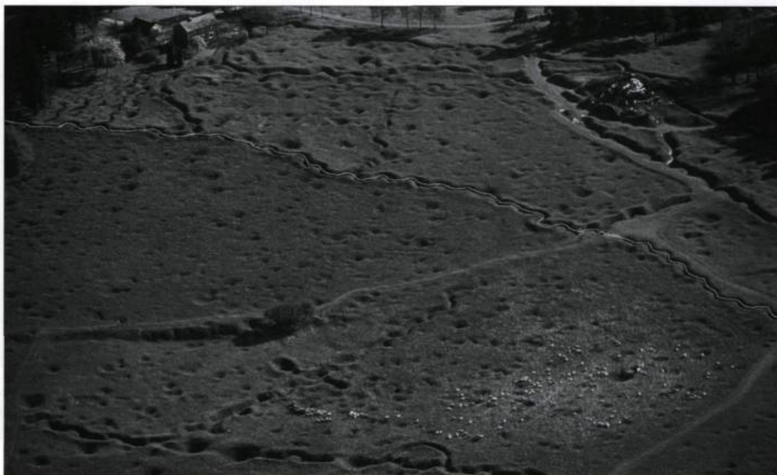
Une portion du site de Beaumont-Hamel marquée par les tranchées et les trous d'obus de la Grande Guerre. La ligne de front alliée de 1916 est tracée en blanc.

Un dépotoir secondaire, constitué lors des activités de nivellement et de réaménagement du terroir après la guerre, a été mis au jour près de