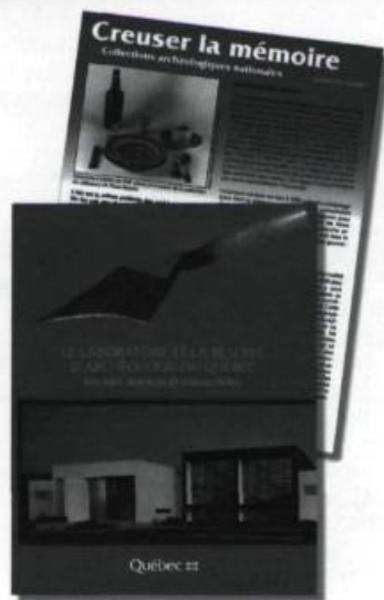
Creuser la mémoire, tiré à part de Cap-aux-Diamants inséré dans Les laboratoires et la réserve d'archéologie du Québec , ministère des Affaires culturelles, 1992.

Tremblay, Sylvie. «Cyprien Tanguay, l'auteur du dictionnaire», Cap-aux-Diamants , n° 13 (printemps 1988), p. 68.