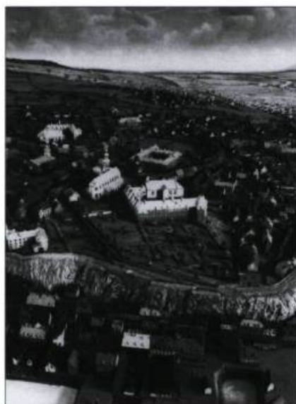
Extrait de la maquette Duberger, qui représente Québec au début du XIX e siècle. (Inventaire des biens culturels du Québec, Québec-Plans, 13,303, D-8).

De Lagrave, Jean-Paul. «Un livre d'histoire : le château Ramezay», Cap-aux-