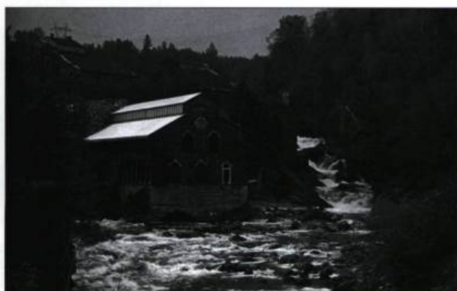
La pulperie de Chicoutimi. (Carte postale).

Lapointe, Camille. «Lieux de culte et de sépultures», Cap-aux-Diamants , n° 26 (été 1991), p. 65.