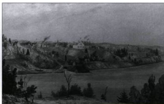
Les Forges de M. Bell sur le Saint-Maurice. Anonyme, sépia et aquarelle, 1844. (Archives publiques du Canada, C-1241).

Back, Francis. «Deux baleiniers basques au XVI e siècle», Cap-aux-Diamants , n° 52 (hiver 1998), p. 58.