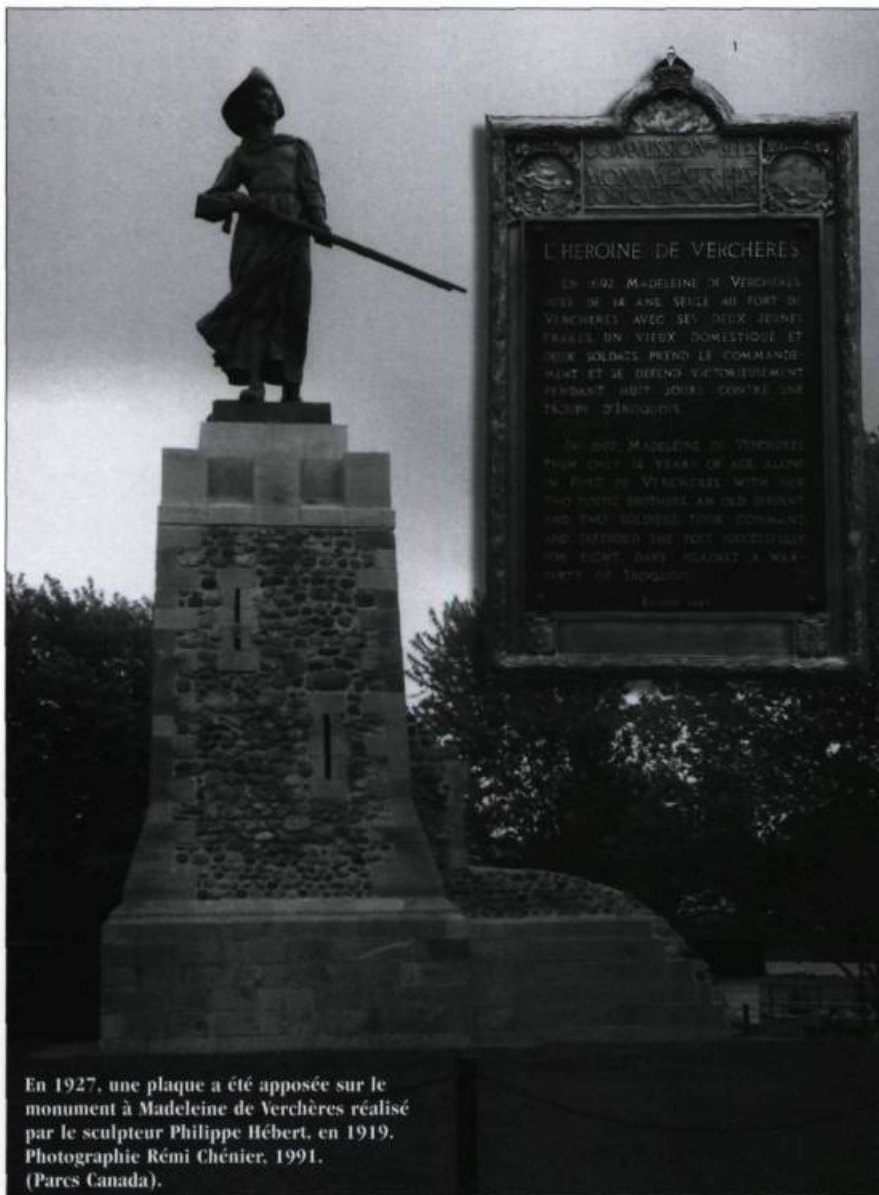
En 1927, une plaque a été apposée sur le monument à Madeleine de Verchères réalisé par le sculpteur Philippe Hébert, en 1919.

Comment expliquer le tout? Les années fortes correspondent à celles où le brigadier-