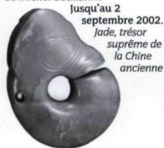
Jusqu'au 2 septembre 2002. Jade, trésor suprême de la Chine ancienne

Jusqu'au 5 janvier 2003. 1, rue des Apparences Jusqu'au 2 septembre 2002. Xi'an contemporaine Photographies de Michel Boulianne