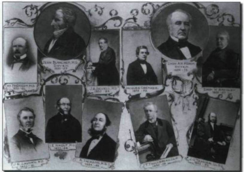
Les professeurs de la Faculté de médecine en 1853 (à gauche) et ceux de la Faculté de droit en 1852-1855 (à droite). ( Université Laval 1852-1902).

8 décembre 1852 accorde les pouvoirs de «conférer des Degrés» et «tous les droits, pouvoirs et privilèges d'université». À l'aube de son bicentenaire, l'institution ajoute ainsi une troisième œuvre aux deux originelles et prend les moyens de les contrôler entièrement toutes les trois : le supérieur et les directeurs