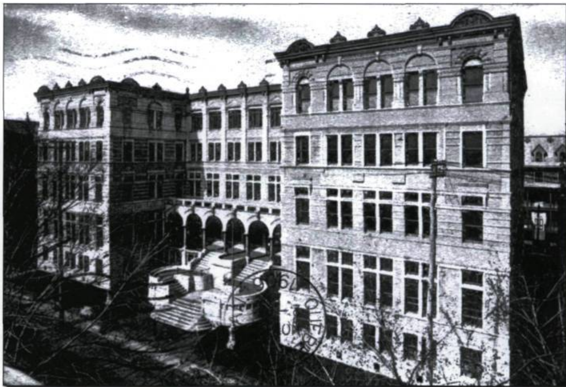
Université Laval à Montréal. Carte postale vers 1906.