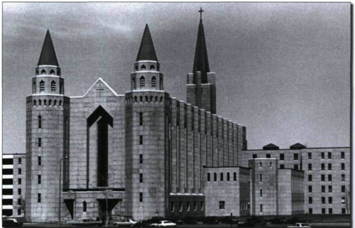
■ Le Grand Séminaire construit d'après les plans d'Ernest Cormier en 1958 sur le campus de Sainte-Foy (aujourd'hui pavillon Louis-Jacques-Casault).