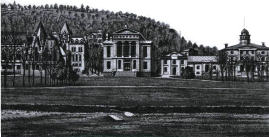
L'Université McGill de Montréal a obtenu sa chartre en 1829.

Heureusement, la Commission des écoles catholiques de Montréal, appuyée par le Département de l'instruction publique, créait, en 1873, une école de sciences appliquées : l'établissement porta bientôt le nom de Polytechnique. Du côté de la préparation au monde des affaires, c'est la Chambre de commerce de Montréal qui fut à l'origine, en 1907, de la création de l'École des Hautes Études Commerciales. Ces deux institutions seront éventuellement affiliées à l'Université de Montréal. Du côté de Québec, il faut attendre le premier conflit mondial pour voir la création des écoles de commerce, de chimie, de génie et de foresterie. C'était dans tous les cas une entrée plutôt tardive des institutions francophones, sous la forme d'écoles affiliées plutôt que de facultés de plein droit, dans la forma-