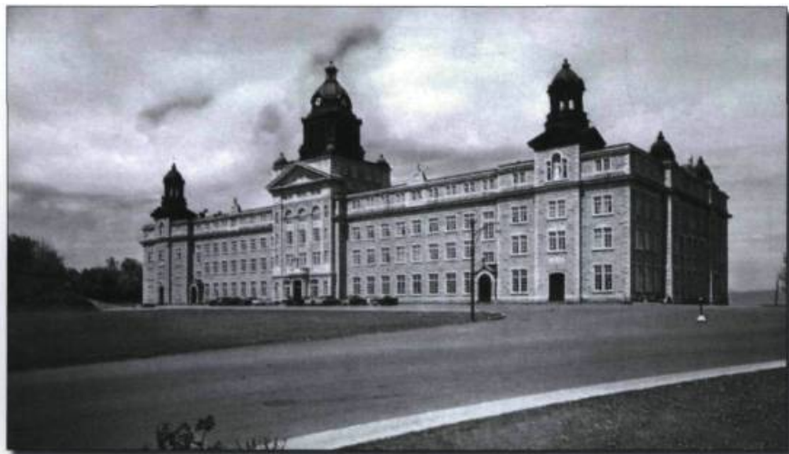
■ Collège de Sainte-Anne-de-la-Pocatière. (Archives de Cap-aux-Diamants).

Les Québécois de langue française participaient de façon fort congrue aux études supérieures. Les deux premières lignes du tableau, qui tiennent compte des inscrits de la Faculté des arts, montrent que les francophones ne faisaient pas si mauvaise figure. C'est largement illusoire quand on songe que la formation classique n'était aucunement professionnalisante, en ce sens qu'elle ne procurait aucune compétence utilisable sur le marché de l'emploi. Les deux lignes suivantes ignorent les étudiants des facultés des arts pour ne retenir que les programmes ayant un caractère professionnel. Elles témoignent de l'accès des deux groupes culturels aux emplois de cols blancs. Les catholiques, en très grande majorité de langue française, paraissent particulièrement peu choyés.