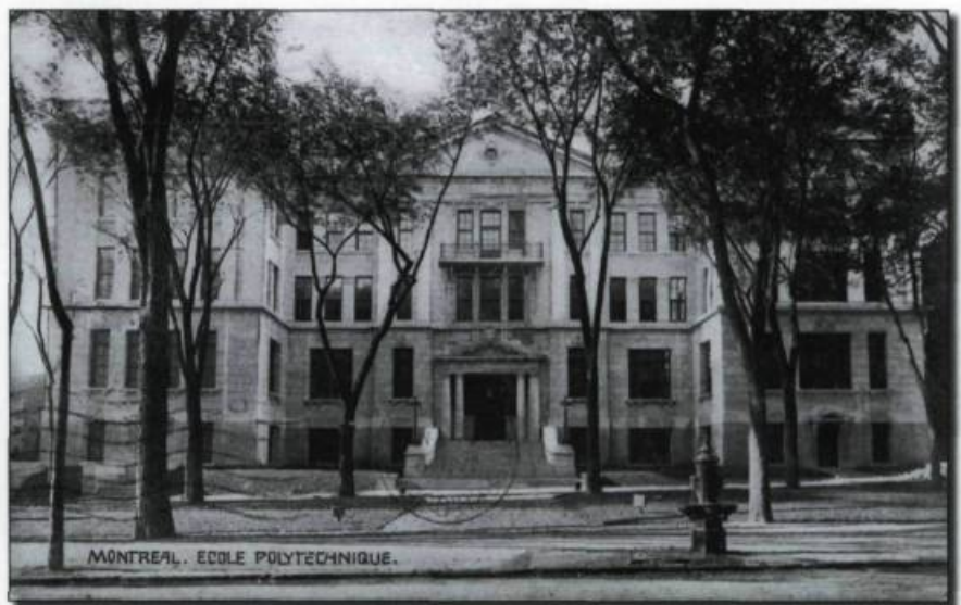
■ École polytechnique de Montréal. Carte postale vers 1915.

La formation classique demeura longtemps l'apanage des garçons. Les jeunes filles qui poursuivaient leurs études après la formation primaire accédaient aux cours modèle et académique, même si le menu offert par certaines congrégations religieuses présentait parfois des ambitions encyclopédiques, et que les diplômes – qui n'avaient pas un caractère officiel – prenaient des appellations ronflantes. Un premier collège féminin vit le jour à Montréal au début du XX e siècle, il y en eut un second à Québec dans les années 1920. Ils se multiplièrent ensuite d'autant plus lente-