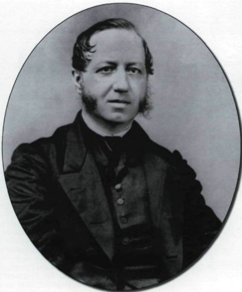
Pierre-Joseph-Olivier Chauveau (1820-1890), premier ministre de 1867 à 1873 et ministre de l'Instruction publique (1868-1873).

Ce n'étaient pas toutes les catégories de la population qui avait accès à cet ordre d'enseignement. Les moins bien nantis s'en trouvaient exclus, bien sûr, sauf les jeunes hommes qui accédaient aux études en théologie grâce au soutien de quelques bonnes âmes. Les jeunes femmes y furent admises très progressivement, dans des programmes essentiellement culturels d'abord. Ce ne fut que pendant les années 1920 que l'on vit les premières admises dans les facultés de droit ou de médecine francophones, et toujours en nombre infime.