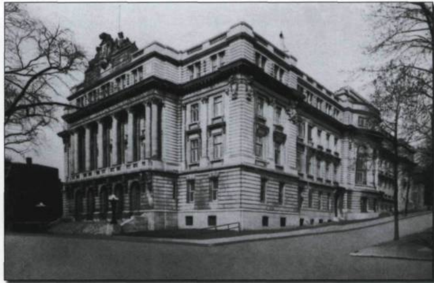
■ Entrée de l'École des Hautes Études Commerciales de Montréal.

Du XVII e jusqu'au milieu du XIX e siècle, les jeunes francophones n'ont pu profiter que du cours classique : exceptés quelques cours d'hydrographie financés par la couronne française, il ne se donnait pas d'autre formation de niveau supérieur. Les professionnels, s'ils n'avaient pas fréquenté l'université à l'étranger, avaient été formés selon le régime de l'apprentissage, ou encore dans des écoles de médecine ou de droit créées grâce à l'initiative privée. Les établissements de ce genre furent toujours éphémères. Si l'apprentissage de la langue française supplantait celui du latin au XIX e siècle – ce dernier devient surtout un moyen de mieux maîtriser la première –, tout le programme de ces institutions était profondément marqué du souci de