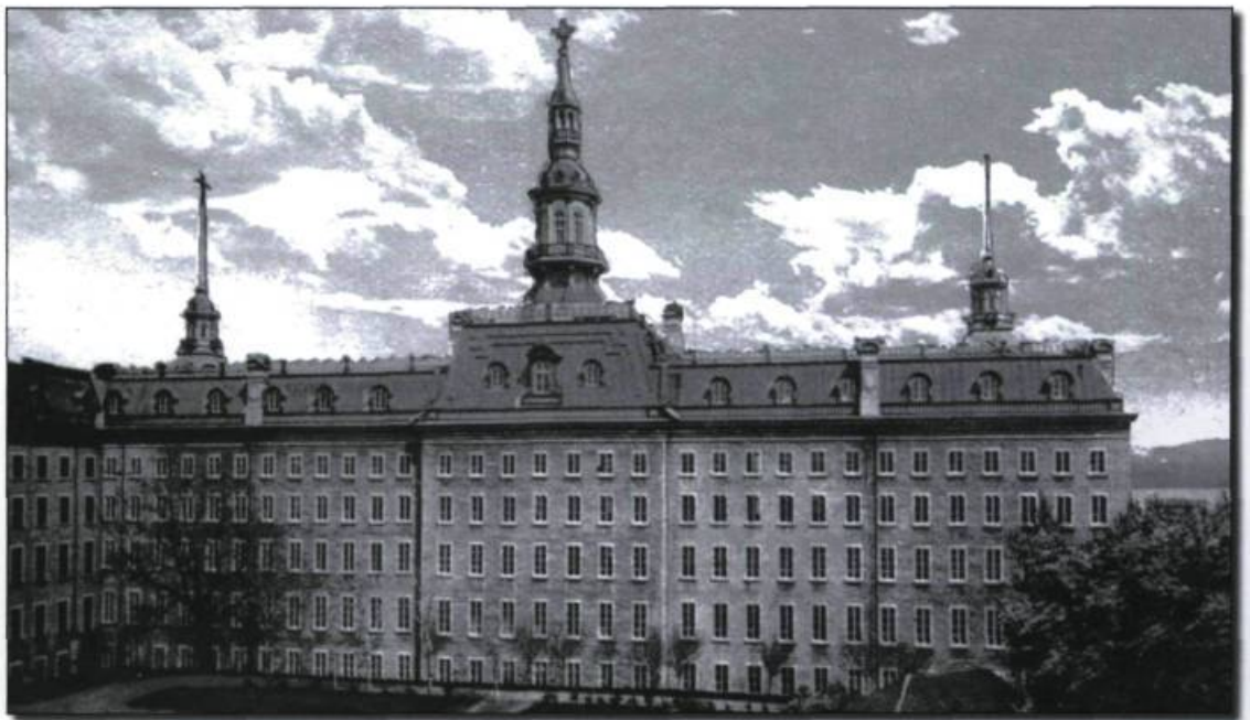
L'Université Laval, vers 1915. Carte postale J.-P. Gosselin. (Banque d'images de Cap-aux-Diamants).