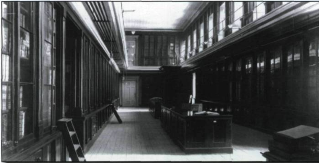
La bibliothèque de l'Université Laval en 1914.

domadaires pour le loisir familial. En 1895, ce dynamisme ambiant conduit à l'émergence de l'École littéraire de Montréal, association par laquelle Nelligan, entre autres, fait connaître son œuvre. Pour ce qui est des arts plastiques et de la musique, domaines où la frontière linguistique joue forcément beaucoup moins, la richesse économique de Montréal leur assure un marché relativement très actif. L'Art Association of Montreal, le Conseil des arts et manufactures et les concerts donnés au parc Sohmer ou les saisons de la Montreal Opera Company représentent des institutions sans équivalents à Québec.