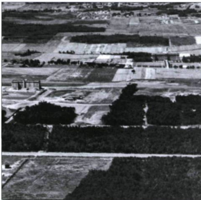
En septembre 1945, le Séminaire de Québec se porte acquéreur d'un immense terrain appartenant aux Frères des Écoles chrétiennes sur les hauteurs de Sainte-Foy. En 1946, commence la construction du pavillon de la Faculté de foresterie et de géodésie.