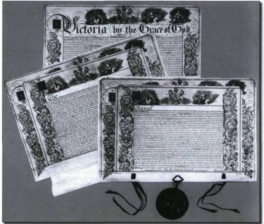
Le 8 décembre 1852, la reine Victoria octroie une charte au Séminaire de Québec donnant naissance à l'Université Laval.

On annonce le début de la construction d'un édifice pour la Faculté de médecine. L'édifice ouvrira d'un côté dans la rue Saint-Georges et, de l'autre, dans une nouvelle rue parallèle, que le Séminaire se propose