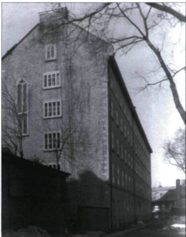
Construit vers 1855, le pensionnat de l'Université ferme ses portes en 1893. Photographie de Jules-Ernest Lavernois, 1883. (Archives du Séminaire de Québec).

Louis-Philippe Bonneau est nommé vice-recteur. Il s'agit du premier laïc à occuper un tel poste à l'Université Laval.