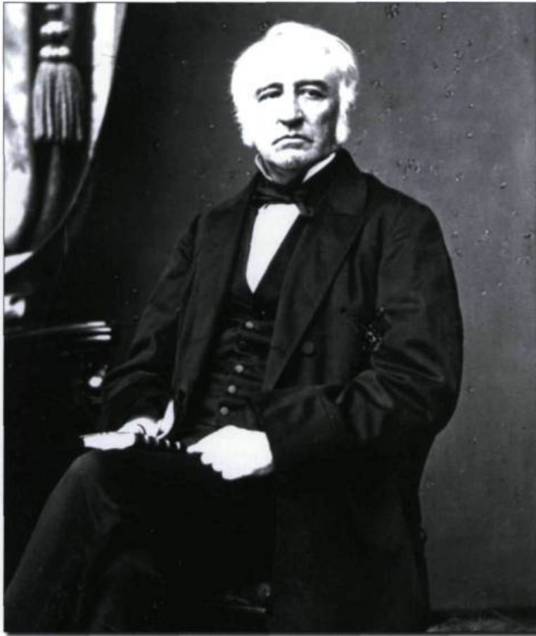
Augustin-Norbert Morin est nommé professeur et doyen de la Faculté de droit le 13 juin 1854. Photographie de Jules-Ernest Livernois. (Archives nationales du Québec à Québec).

gnement de la musique à tous les niveaux, est élevée au rang de faculté le 21 mai 1997.