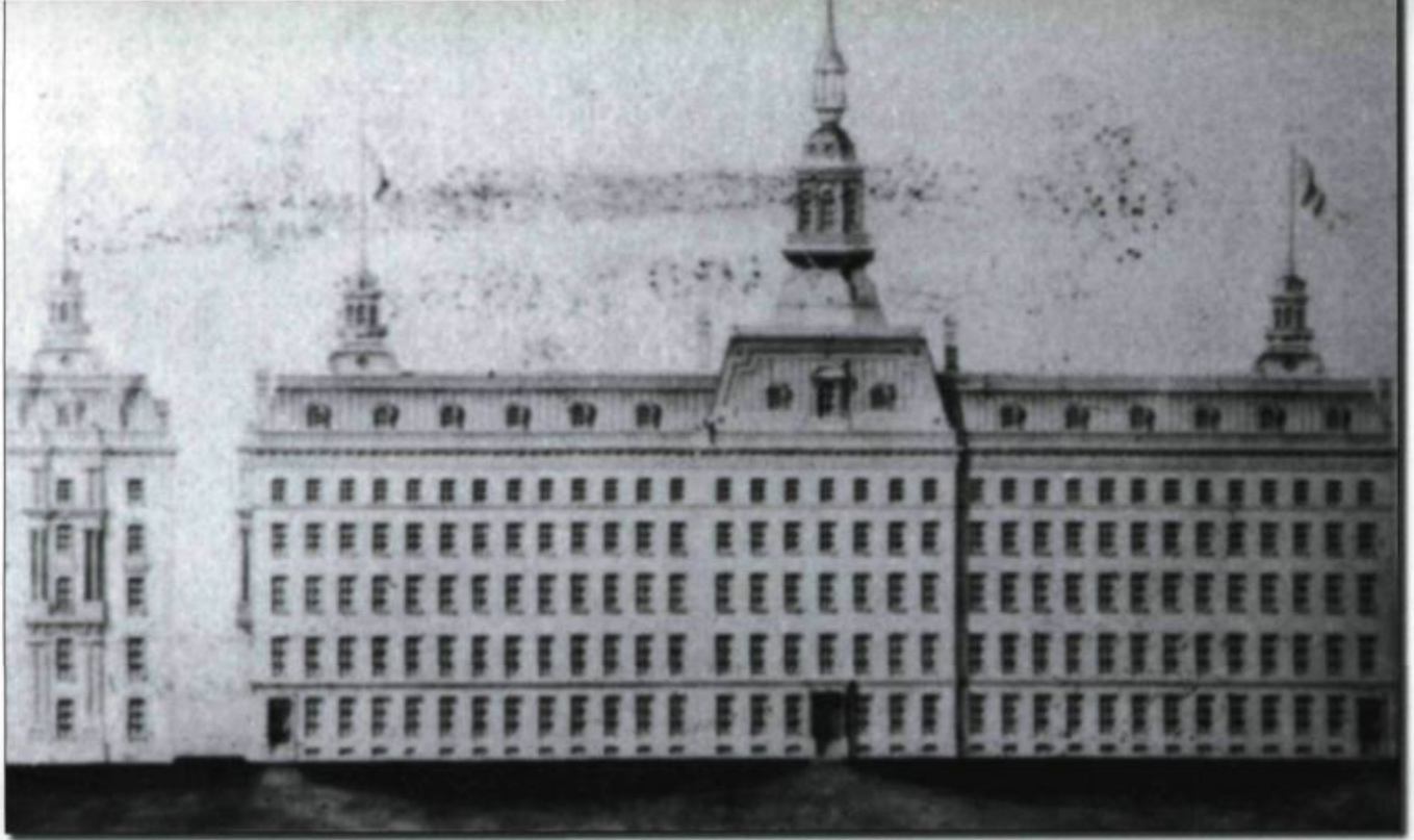
Le 21 septembre 1854, après une messe pontificale, on pose la première pierre du pavillon central dont les plans ont été tracés par Charles Baillaigé.