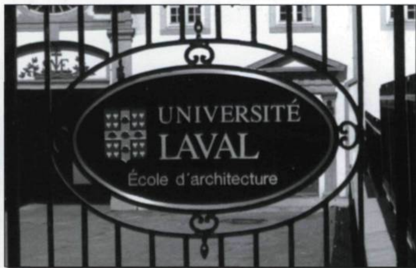
Entrée de l'École d'architecture dans l'ancien Petit Séminaire de Québec. Photographie Yves Beauregard, 1993. (Banque de photos de Cap-aux-Diamants).

L'Université Laval et la Société en commandite Dominion Corset achètent en copropriété indivise l'édifice de la fabrique situé dans le quartier Saint-Roch, à Québec. L'École des arts visuels y inaugure ses nouveaux locaux le 13 octobre 1994.