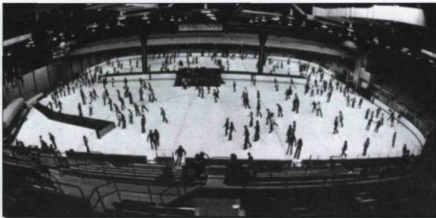
Inauguration de l'aréna du PEPS, en 1976.

Adoption par le Conseil de l'Université de la Déclaration des droits des étudiants et des étudiantes de l'Université. Aboutissement d'une idée lancée par la CADEUL, en 1983, cette déclaration est entrée en vigueur en septembre 1989.