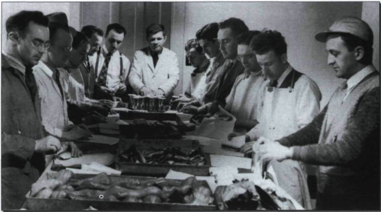
Ouverture de l'École supérieure des pêcheries, à Sainte-Anne-de-la-Pocatière, en 1938. Photographie vers 1950.