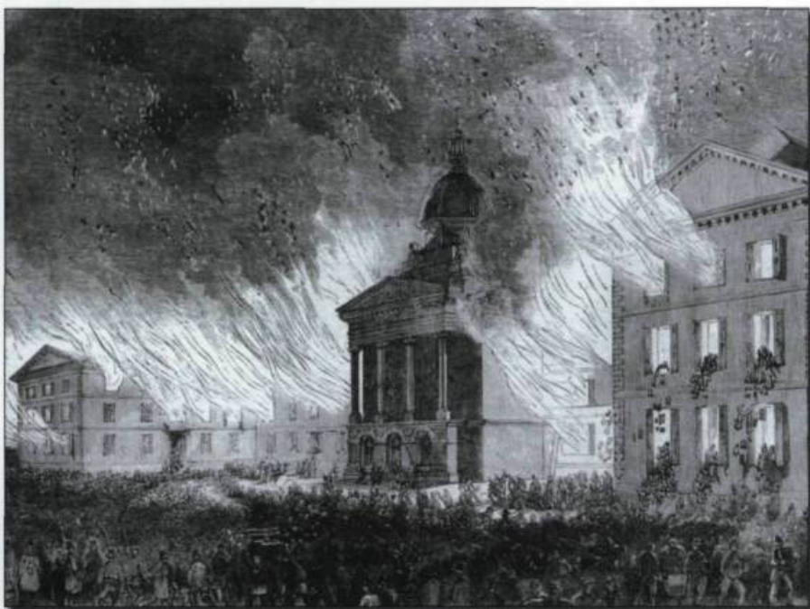
Les étudiants du Séminaire de Québec sauvant les volumes de la Bibliothèque du Parlement lors de l'incendie de 1854. (Charles de Volpi. Québec).

La mission assignée à la Bibliothèque de l'Assemblée a évolué au cours des années. Au moment de sa création, les livres étaient réservés à l'usage exclusif des parlementaires. Par la suite, comme le milieu était dépourvu de bibliothèques, on a ouvert les portes aux lecteurs de la capitale, avec certaines restrictions cependant : avoir obtenu une recommandation d'un parlementaire; et utiliser la Bibliothèque uniquement durant les intersessions et pendant les vacances parlementaires. La pratique de l'ouverture au public a va-