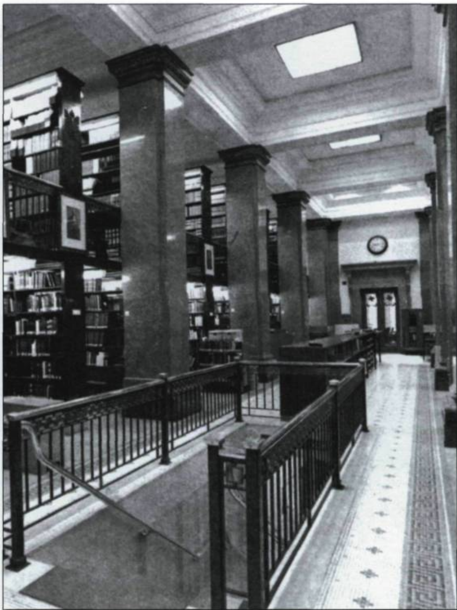
Intérieur de la Bibliothèque du Parlement dans l'édifice Pamphile-Le May, en 1986.

L'évolution bicentenaire de la Bibliothèque de l'Assemblée nationale est marquée de processus administratifs changeants. À l'origine, la Bibliothèque est apparue dans une Assemblée dont les structures administratives étaient rudi-