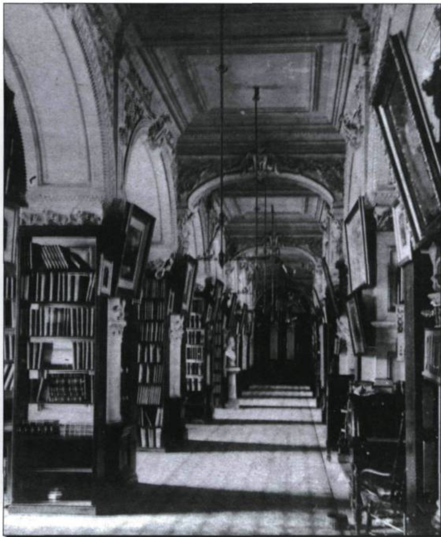
La Bibliothèque est toujours logée dans l'Hôtel du Parlement en 1910. (La Presse).

pus de philosophie et de théologie, de génie ou d'histoire des sciences, de littérature ou de généalogie. Une grande partie de ces collections a été élaguée et a laissé place à des volumes et à des périodiques tombant dans l'orbe de la vie et des institutions politiques, à la limite de la vie culturelle, sociale et économique, avec une teinte fortement québécoise mais allant également au-delà.