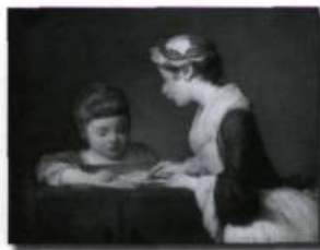
Les gens les mieux nantis pouvaient se payer un précepteur ou une gouvernante pour assurer l'enseignement à leurs enfants. Une gouvernante et son élève , peinture de Jean-Siméon Chardin, 1739. (Archives de l'auteur).

Dans une recherche de sanctification, des catholiques des deux sexes décidaient de vivre en communauté et de se consacrer à leurs semblables. Certaines congrégations jouèrent un rôle considérable dans l'enseignement. C'était à elles que l'Église préférait voir confier l'éducation des enfants.