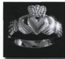
Bague foi en or ou «claddagh», du nom d'un village irlandais. Mains entourant un cœur surmonté d'une couronne : «Que l'amour et l'amitié règnent!» (vers 1860). (Collection privée).