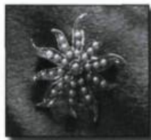
Broche pendentif en or au motif d'étoile, ornée de perles fines (vers 1885). (Collection La Boîte à Bijoux).

l'entremise du jais, de l'onix et de la marcasite) ainsi que le blanc (par le port de diamants et de perles symbolisant les larmes) deviennent très répandus. Le courant romantique en France, figuré entre autres par Alphonse de Lamartine et François René de Chateaubriand en littérature, Eugène Delacroix en peinture et Hector Berlioz en musique, exalte l'expression personnelle, ce qui stimule la création de bijoux sentimentaux ( sentimental jewelry ).