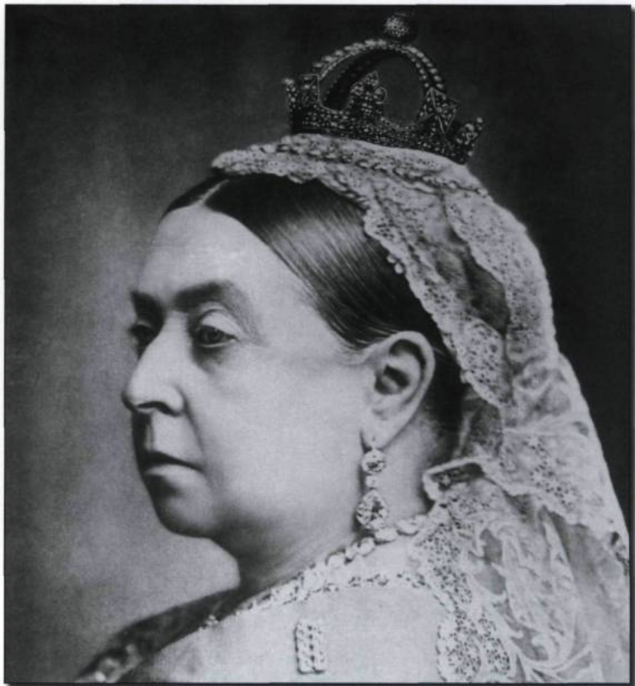
Victoria, reine de Grande-Bretagne et impératrice des Indes. Photographie, 1898.

Quelques années auparavant, Sir Walter Scott avait écrit une nouvelle qui freine la demande pour les bijoux en opale. Il y dépeint cette variété de silice comme une source de malchance si elle n'est pas la