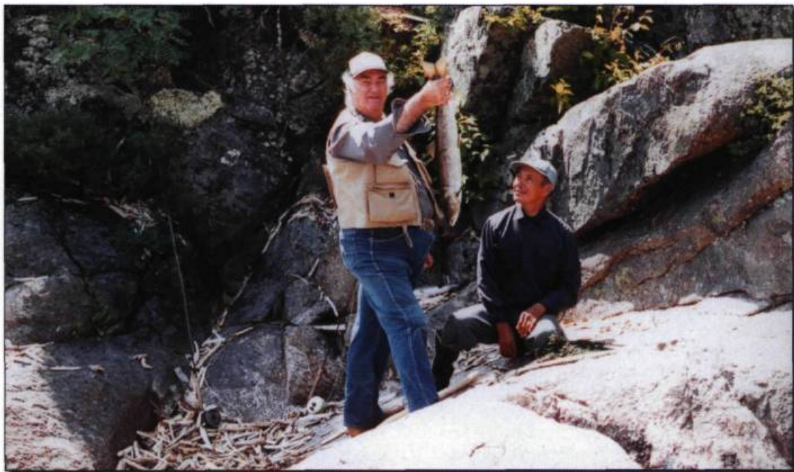
Une partie de pêche au saumon à Natashquan, vers 1995.

grands clubs privés de la région de Portneuf, fréquentés par de riches Américains, comme le Triton et le Tourilli. Nous gérons maintenant le territoire public du Tourilli.