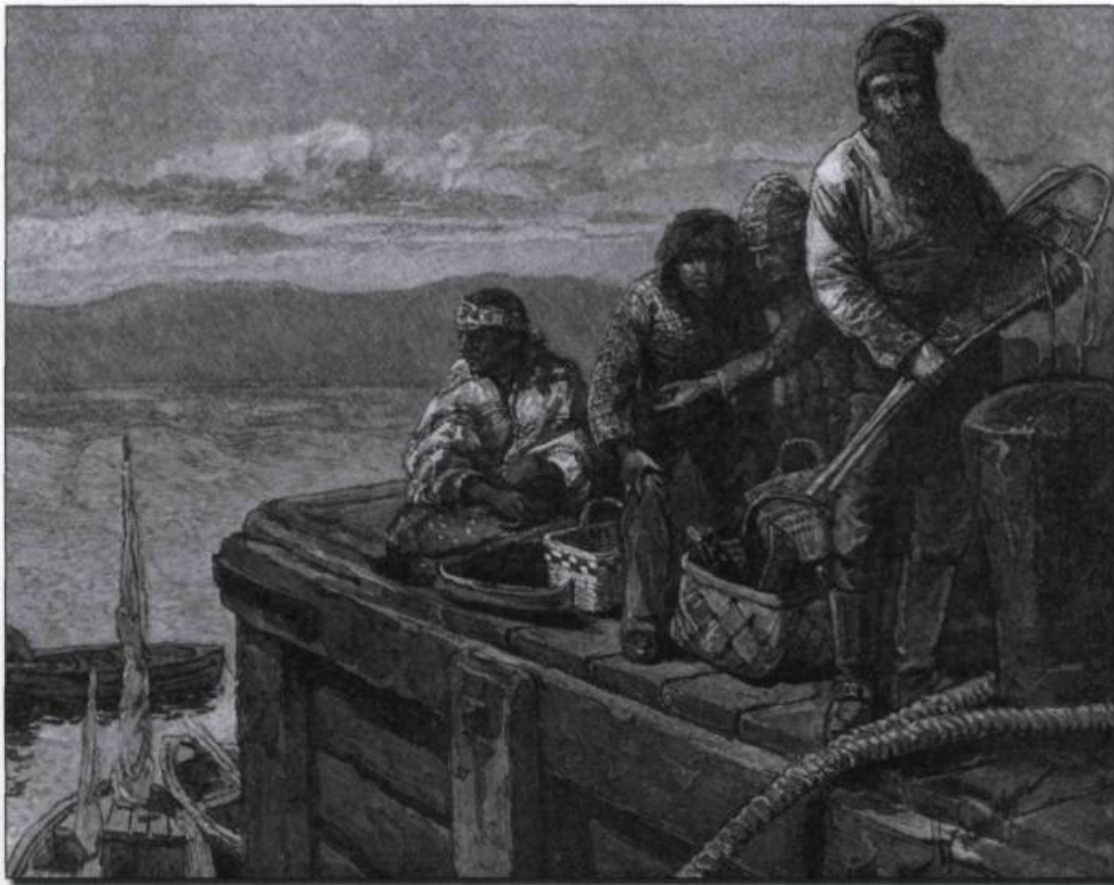
Les vendeurs de souvenirs au quai de Cacouna, gravure publiée dans le Harper's Magazine, en 1884.

Georgienne, qui contrôle le commerce général, et particulièrement celui des fourrures, dans cet immense bassin hydrographique. La langue huronne-wendate est la langue internationale du commerce de cette époque. Nos chefs viennent régulièrement traiter à Québec, à partir de 1610. Champlain et nos grands chefs scellent leur alliance en échangeant des enfants qui vont vivre chez l'un et chez l'autre. Champlain visitera la Huronie ou Wendake, en 1615.