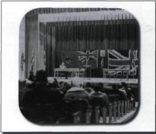
Let us act like true Canadian, scène tirée de L'Acadie, l'Acadie!!! de Pierre Perrault (1970), montrant une réunion de la Maritime Loyalist Association.