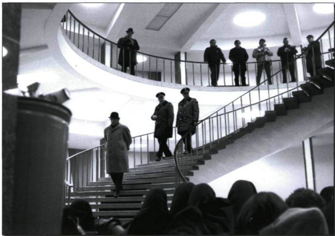
Photo tirée du film L'Acadie, l'Acadie!!! , de Michel Brault et Pierre Perrault. À l'Université de Moncton, en 1969, la police municipale veut forcer un groupe d'une centaine d'étudiants francophones à mettre fin à leur occupation du campus. Mais les caméras de l'ONF sont présentes lors de l'événement et les autorités hésiteront à utiliser la force. Au bas de l'escalier se trouve le chef de police, lui-même francophone, qui parlementera en français. Photo : Office national du film du Canada. Tous droits réservés. (Archives de l'auteur).

Il appartient aux Acadiens de déterminer si la situation a beaucoup changé depuis cette