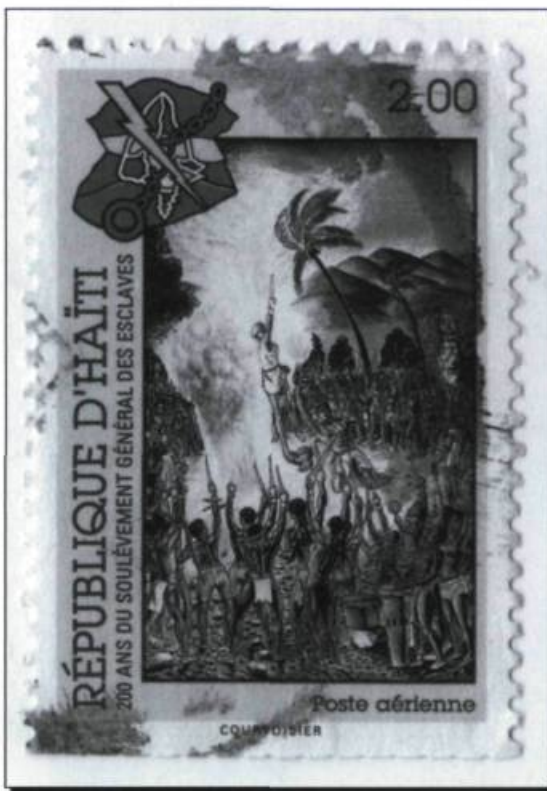
■ Timbre de la république d'Haïti commémorant le bicentenaire du soulèvement des esclaves. (Collection Yves Beaugard).