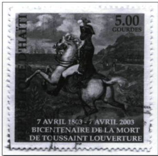
Timbre de la république d'Haïti commémorant le bicentenaire du décès de Toussaint Louverture (2003)..

XYZ éditeur, 1781, rue Saint-Hubert, Montréal (Québec) H2L 3Z1 Téléphone : (514) 525.21.70 • Télécopieur : (514) 525.75.37 Courriel : info@xyzedit.qc.ca • www.xyzedit.qc.ca