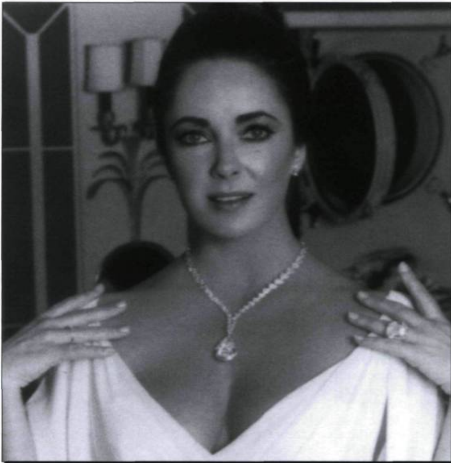
Elizabeth Taylor, lors d'une réception chez Grace de Monaco, portant ses deux plus gros diamants : le collier est décoré du diamant Taylor-Burton pesant 69,42 carats, taille poire, acheté 1 100 000 $ par Richard Burton; la bague est sertie du diamant Krupp pesant 33,19 carats, taille émeraude, acheté, en 1968, pour 305 000 $. Ce dernier tient son nom de Vera Krupp, ancienne épouse du trop célèbre marchand de canons allemand.