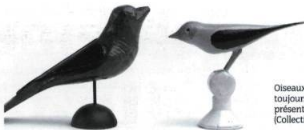
Oiseaux du passé, souvenirs toujours vivants dans le moment présent. Photo Maxime Côté. (Collection privée).

Quand il se sculpte une gueule de bois... C'est l'homme spontané Qui dessine et découpe Dans le sens de la vie Et qui le geste large Et le cœur ingénu Façonne et retranscrit À sa façon... à lui