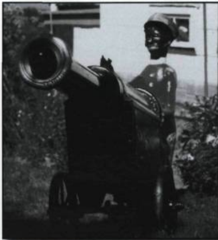
Fidèle à son poste, un artilleur coloré protège, avec son canon muet, un royaume imaginaire à Cap-Saint-Ignace. (Photo Jean Lafrance).

Les gens de la région, les passants du dimanche ou bien les vacanciers qui découvrent, étonnés, ces drôles de patentes, ces astucieuses inventions, ces choses saugrenues... et qui klaxonnent leur approbation, descendent de l'auto pour prendre des photos ou faire la conversation... « Comme c'est beau! Comme ça prend d'la patience! Que ça doit donc être long – l'été est tellement court! – d'installer, d'arranger et ensuite, de couper le gazon autour de ces décorations! »