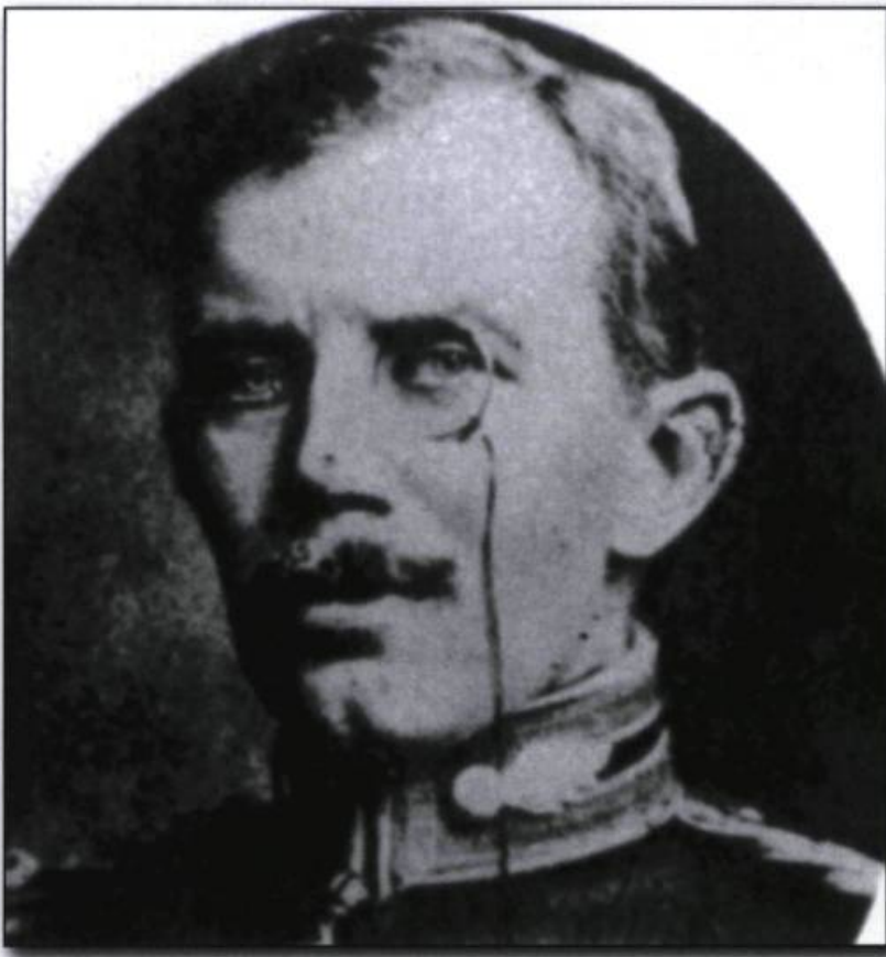
Sir Percy Girouard (1867-1932). Né à Montréal, il fut l'un des plus grands administrateurs impériaux que l'Angleterre ait eu à son service.

l'œuvre. Imaginez un personnage qui allie « la hardiesse française dans la conception, l'ingéniosité américaine et la ténacité anglaise », écrira le correspondant de guerre britannique George Steevens. Churchill notera que Girouard dressa une liste exhaustive de tout ce qui serait nécessaire à l'exécution du projet, jusqu'au moindre boulon, avec le résultat que chose impossible est chose faite dès le 1 er novembre 1897. En janvier 1898, on prolonge la ligne jusqu'à Atbara, au confluent de la rivière de ce nom et du Nil. Le 3 juillet, le service ferroviaire est en place sur une distance de 620 kilomètres. « Il était maintenant possible de transporter au cœur du Soudan en temps voulu et prestement de grandes armées, de les ravitailler abondamment en nourriture et en munitions sans avoir à se soucier de la saison ou des ressources du pays, d'écrire Churchill ». Le 2 septembre à Omdurman, en face de Khartoum, les troupes égyptiennes et anglaises anéantirent les mahdistes. On compte 48 morts du côté des vainqueurs, 11 000 chez les vaincus.