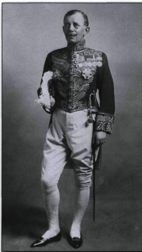
Percy Girouard en 1912 en tenue d'apparat.