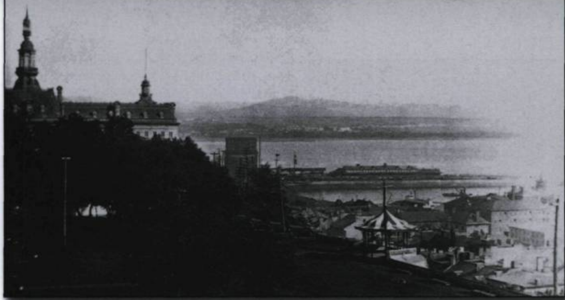
Le parc Frontenac vers 1898.

hôtel du Parlement, sur le terrain appelé Cricket Field, face aux fortifications. Les députés et fonctionnaires y emménagent plus vite que prévu puisque le 19 avril 1883, l'hôtel du Parlement est une fois de plus détruit par un incendie.