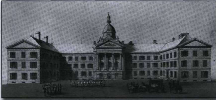
■ Premier parlement vu de l'avant. Litographie de Sarony et Major publiée à New York en 1852.

du Conseil souverain et seigneur de l'arrière-fief Monceaux de la seigneurie de Sillery, puis par l'intendant Jean Talon. C'est finalement en 1688 que M re Jean-Baptiste de La Croix de Saint-Vallier, deuxième évêque de Québec et successeur de M re François de Laval, acquiert le terrain. On y ajoute éventuellement le lot voisin occupé par le premier cimetière de la ville et on se départit de plusieurs autres parcelles, de sorte qu'en 1732, les limites actuelles du parc Montmorency sont fixées. En faisant l'acquisition de ce bien-fonds, M re de Saint-Vallier achète également la maison en pierre à deux étages qui s'y trouve. Celle-ci fait désormais office de premier palais épiscopal et de siège du diocèse de Québec. L'année suivante, l'évêque amorce la construction d'un mur de maçonnerie pour ceindre sa propriété. De 1693 à 1695, il y fait construire un nouveau palais en pierre de taille. Le projet est ambitieux et c'est uniquement l'aile sud-est du bâtiment qui est construite. Après sa mort, seuls M re Pierre-Herman Dosquet et M re Jean-Marie Dubreuil de Pontbriand habitent le nouveau palais.