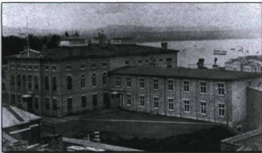
■ Le second parlement en 1865.

l'ensemble du palais, et ce, non sans s'endetter. En 1777, il consent donc à louer l'édifice au gouvernement. Le gouverneur Guy Carleton et ses conseillers législatifs s'y réunissent. C'est alors le début officiel de la vocation politique du lieu, bien que lors de l'incendie du palais de l'intendant, en janvier 1713, le palais épiscopal avait accueilli temporairement l'intendant Michel Bégon et le Conseil souverain.