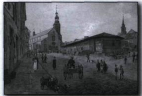
James Pattison Cockburn. La rue de la Fabrique et la cathédrale Notre-Dame de Québec , aquarelle et graphite sur papier, vers 1829. (Collection Peter Winkworth d'œuvres canadiennes, Bibliothèque et Archives Canada).

D'autres créateurs pratiqueront un art dans lequel on peut voir aujourd'hui une chronique de la vie quotidienne et un témoignage sur le développement urbain de la cité. C'est le cas des aquarelles, empreintes de calme et d'harmonie coloniale, du peintre topographe anglais James Pattison Cockburn qui propose diverses vues de la capitale entre 1829 et 1831, des tableaux apocalyptiques que Joseph Légaré consacre aux grandes tragédies – choléra, éboulis, incendies – qui ont bouleversé Québec pendant la première moitié du XIX e siècle, des représentations visuelles réalisées à la fin du XIX e siècle par Jules-Ernest Livernois qui utilise alors une nouvelle technique, la photographie, dont on ne sait pas encore si elle est un art.