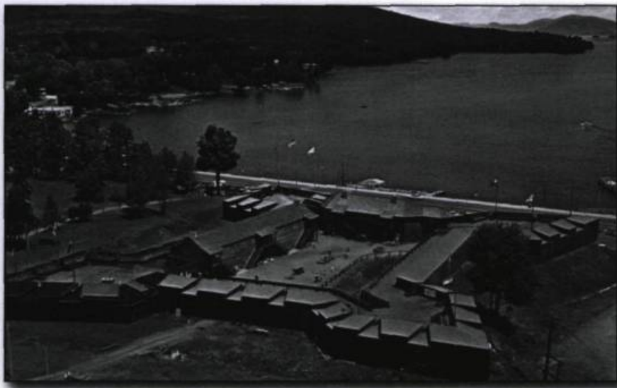
■ En 1757, le marquis de Montcalm s'empare et brûle le fort William Henry à l'entrée du lac George. Carte postale Dean Color, Glens Falls, vers 1965.

richesse sur les plaines centrales et le réseau hydrographique de la baie d'Hudson. Des postes fortifiés y furent érigés, attirant alors une partie des pelleteries autrement destinées à la Compagnie de la baie d'Hudson.