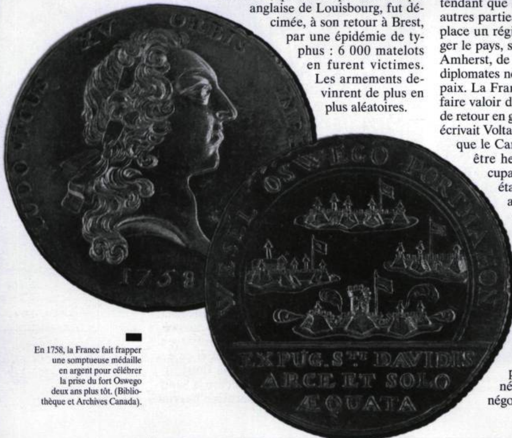
En 1758, la France fait frapper une somptueuse médaille en argent pour célébrer la prise du fort Oswego deux ans plus tôt.

La Motte, qui avait repoussé l'attaque anglaise de Louisbourg, fut décimée, à son retour à Brest, par une épidémie de typhus : 6 000 matelots en furent victimes. Les armements devinrent de plus en plus aléatoires.