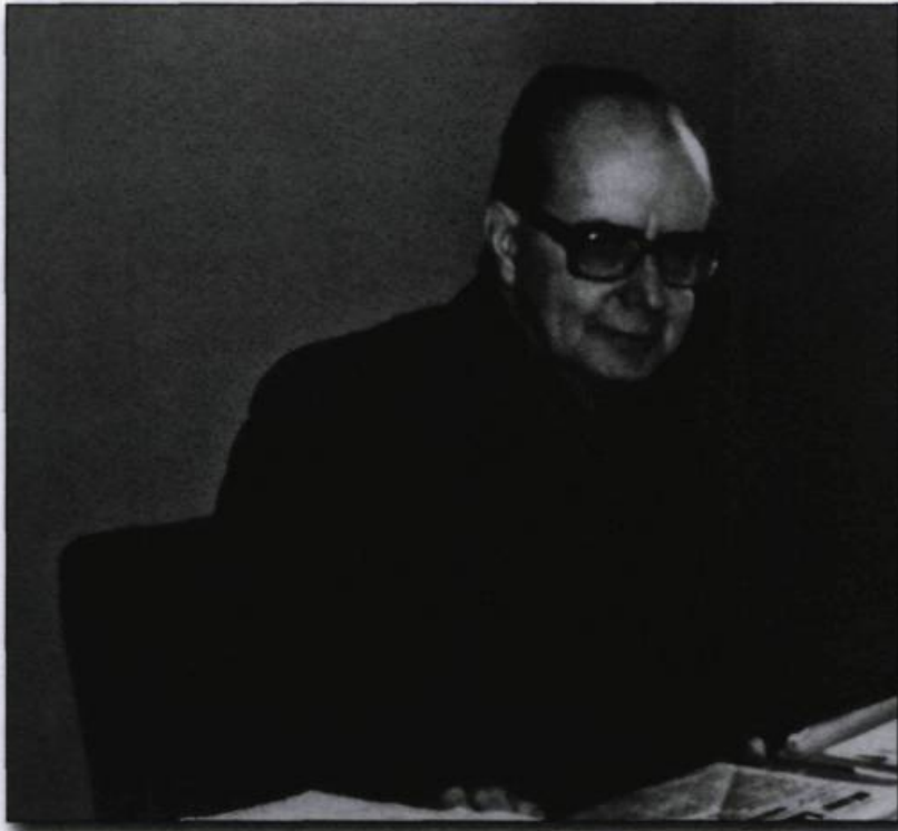
■ Maurice Séguin est né en 1918 à Horse Creek en Saskatchewan et il est décédé en 1984. Historien, il fit carrière à l'Université de Montréal. (Banque d'images de Cap-aux-Diamants, Ph 92-254).

C'est pourquoi la Conquête apparaît aux historiens de l'École de Montréal comme l'événement central de l'histoire des Canadiens français. Elle permet, selon eux, d'expliquer l'origine de leur infériorité économique et des divers retards qu'ils ont accumulés comparativement aux autres sociétés occidentales de l'époque, tout en ruinant ses chances de devenir un jour une nation autonome. Même la tradition nationaliste dominante et l'interprétation du passé qui l'accompagne leur apparaissent comme le signe d'une aliénation collective profonde et subtile qui découle des conséquences de cet événement. En somme, non seulement la Conquête est une épreuve qui n'a pas été surmontée, mais ses conséquences diversifiées se font toujours ressentir dans le présent, même dans la conscience nationale.