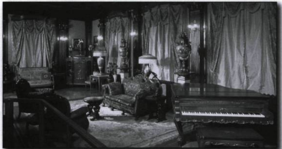
Grand salon de Marius Dufresne.