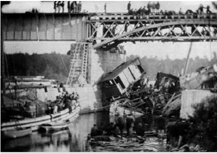
Accident ferroviaire de Saint-Hilaire-Beloeil du 29 juin 1864. (Archives de l'auteur).

l'examen de la vie associative de notre communauté allemande.