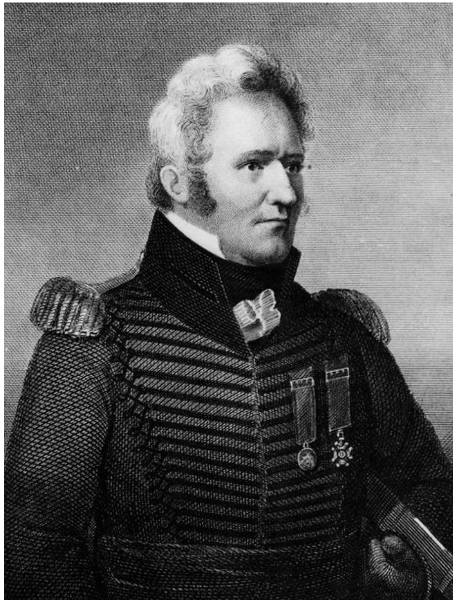
Charles-Michel d'Irumberry de Salaberry (1778-1829). Il a mis sur pied le corps provincial d'infanterie légère (les Voltigeurs canadiens), en 1812, et il a acquis une renommée durable au Canada lorsque 300 à 400 de ses hommes ont vaincu une force de plus de 5 000 Américains à Châteauguay, le 26 novembre 1813.