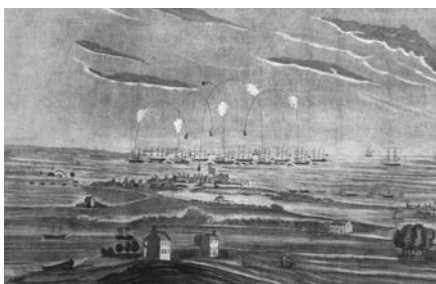
A View of the Bombardment of Fort McHenry, 1814. Gravure de J. Bower, 1816. (Collection Smithsonian).

Aux États-Unis, cette guerre a des conséquences plus importantes sur l'identité américaine. Le blocus continental pratiqué par les Anglais en Europe stimule les initiatives manufacturières américaines et provoque, notamment, la nais-