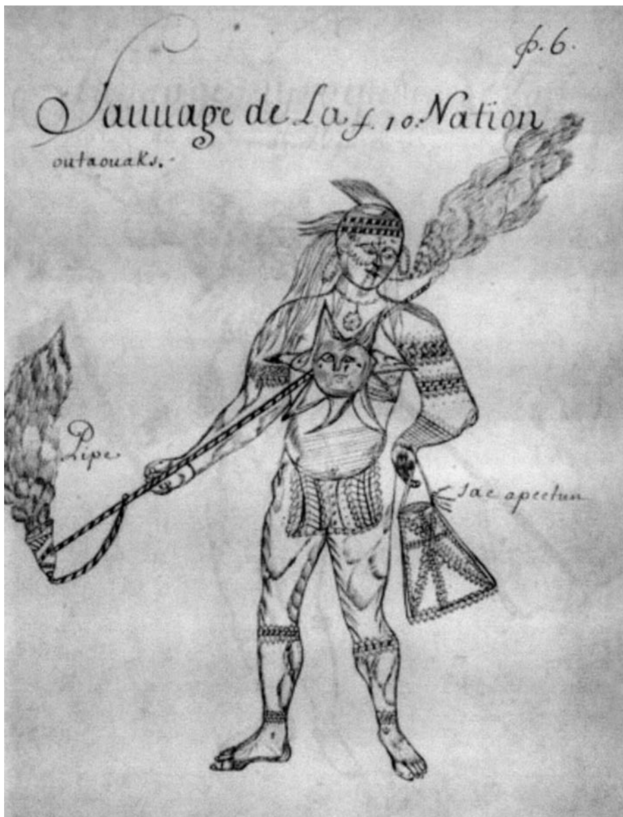
Raretés des Indes , « Sauvage de la nation outaouais », p. 6. (Gilcrease Museum, Tulsa, Oklahoma, États-Unis).

de dompter des ours à la résidence des pères à Sillery et avait formé le projet de montrer ces bêtes au roi à son retour en France! Quoi qu'il en soit, il avait un goût pour l'histoire naturelle et pour l'ethno-