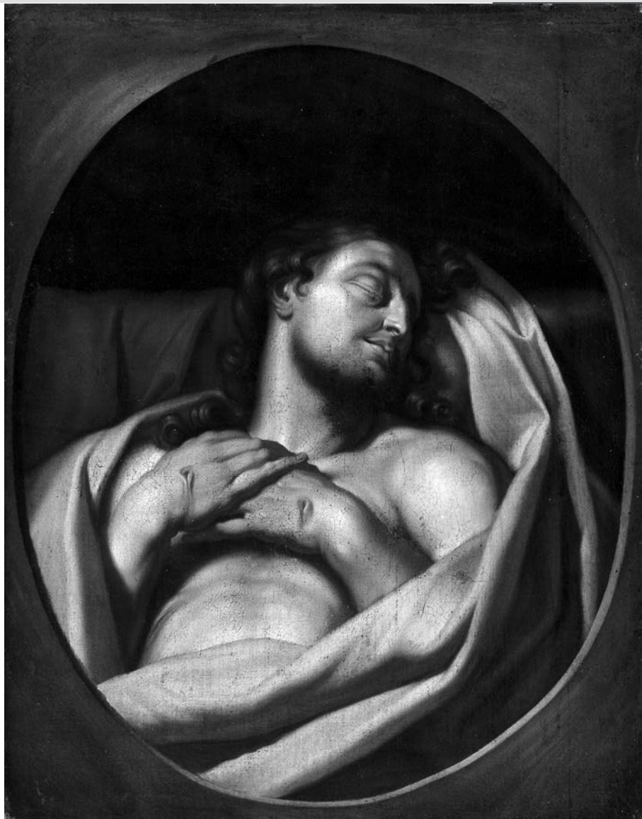
Claude François, dit frère Luc. Le Christ mort. Vers 1670? Huile sur toile, 83,5 x 65,7 cm. (photo avant restauration). Musée des beaux-arts de Montréal. Achat, fonds de la Campagne du Musée 1988-1993 (2011.42).