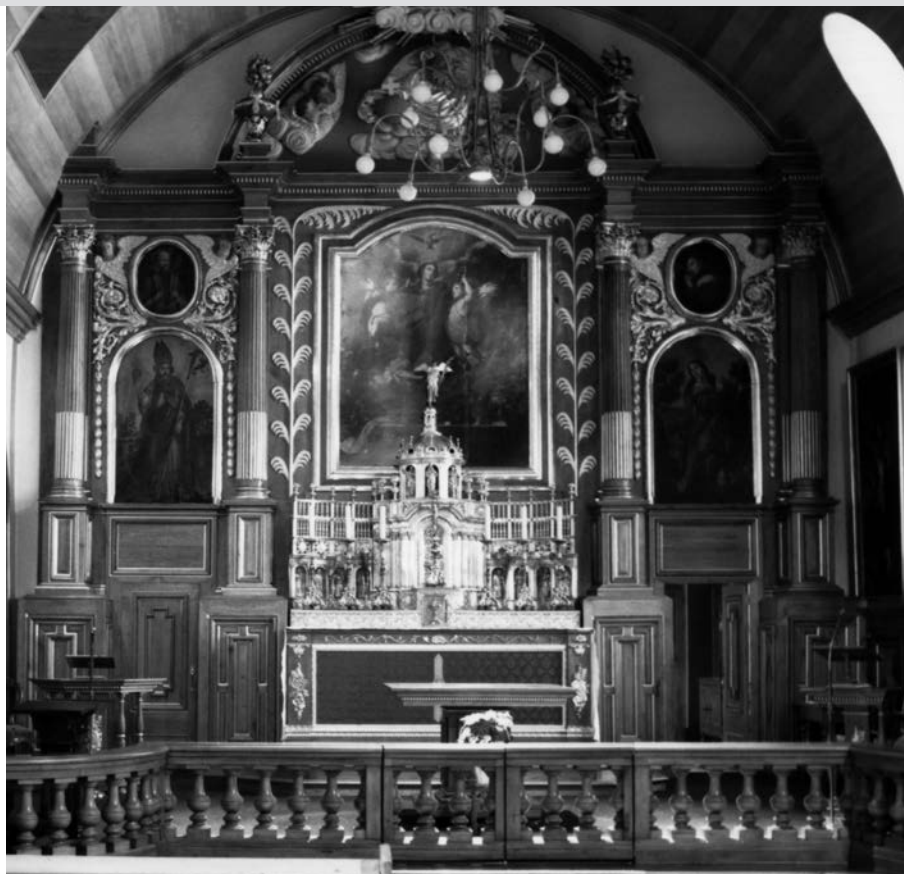
Retable de la chapelle de l'Hôpital Général de Québec. On y aperçoit Saint François adorant le crucifix en haut à droite. Photo Claude Payer, 1985 (détail).

Le Christ y porte la couronne d'épines dont les pointes acérées rendues bien visibles par le halo lumineux qui entoure sa tête nous font imaginer qu'elles la transpercent bien profondément, ce que laisse voir le sang qui s'écoule sur son front, ses yeux révulsés levés au ciel et ses larmes doublés de sang. Comme autre signe de dérision, il tient le roseau en guise de sceptre de l'une de ses mains liées, lui qui a répondu affirmativement à la question de Ponce Pilate : « Es-tu le roi des Juifs? ». Au-delà de la flagellation, le sang qui recouvre entièrement ses épaules a peut-être ici pour objet de remplacer le manteau de pourpre dont on l'avait revêtu. C'est alors la Vierge qui l'enveloppe de son propre vêtement tout en approchant ses lèvres des siennes. L'étoile blanche sur son manteau bleu – que l'on retrouve aussi sur une Mater dolorosa de l'artiste au Musée des beaux-arts de Tours – nous précise qu'il s'agit de la Vierge, la seule dans l'iconographie qui puisse s'approcher de la sorte de la tête du Christ.