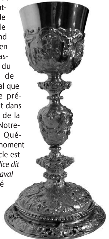
Trioullier Frères, vers 1900. Calice, ruolz.

« Le plus beau des calices de l'église Saint-Ambroise de Loretteville est un grand vase sacré en argent massif, copie du calice dit de M gr de Laval que l'on garde précieusement dans les voûtes de la basilique Notre-Dame de Québec ». Au moment où cet article est écrit, le Calice dit de M gr de Laval est exposé au Séminaire dans le Centre M gr de