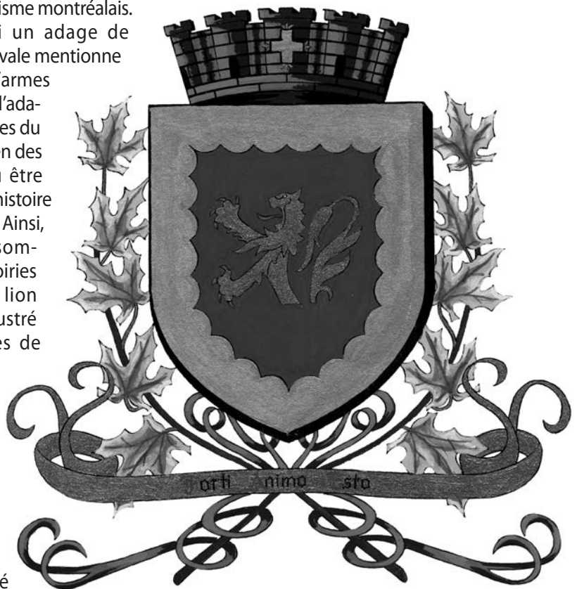
Armoiries de Naudville. (Société d'histoire du Lac-St-Jean).

l'époque médiévale mentionne « Qui n'a pas d'armes porte un lion », l'adage des héraldistes du Collège canadien des armoiries a dû être « Qui n'a pas d'histoire porte un lion ». Ainsi, une analyse sommaire des armoiries révèle que le lion est souvent illustré dans les armes de municipalités ayant une jeune histoire comme Naudville, qui est constituée en municipalité de village en 1944. Le but visé en insérant cette figure étant