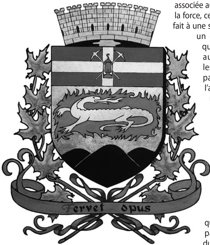
Armoiries de Thetford Mines.

associée aux animaux est celle de la force, ce qui correspond tout à fait à une société où l'on retrouve un gouvernement rigide qui prône le respect des autorités traditionnelles. Les mineurs qui ont participé à la grève de l'amiante, en 1949, pourraient le confirmer. De même, les animaux choisis témoignent des multiples mouvements qui touchent au monde municipal au Québec pendant la première moitié du XX e siècle. En effet, durant cette période, de nombreuses municipalités sont créées, ce qui explique sûrement en partie la forte présence du lion dans les armoiries produites par l'organisme montréalais.