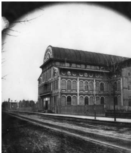
Palais de cristal de Montréal (1879-1896).