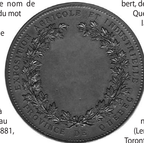
Revers de la médaille conçue par Adolphe-Louis Gerbier pour l'Exposition agricole et industrielle.

par le département du surintendant de l'Instruction publique (ancêtre de