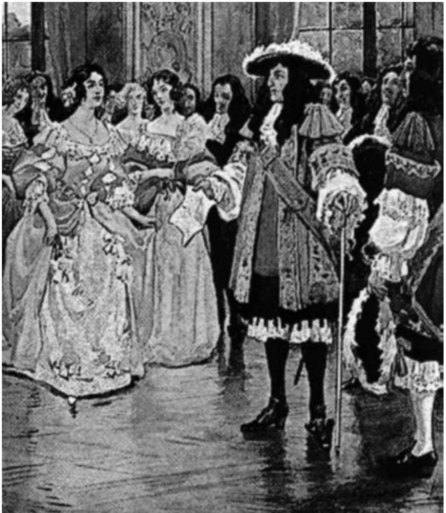
Aquarelle de Charles William Jefferys représentant Louis XIV recevant des recrues qui immigrent en Nouvelle-France.