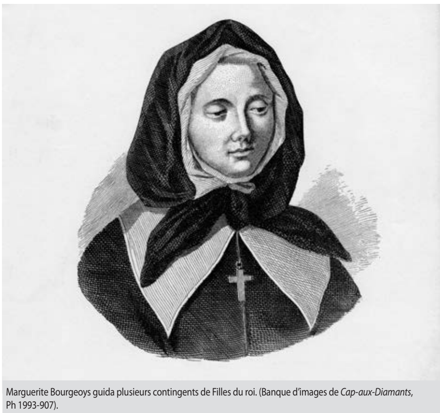
Marguerite Bourgeoys guida plusieurs contingents de Filles du roi.