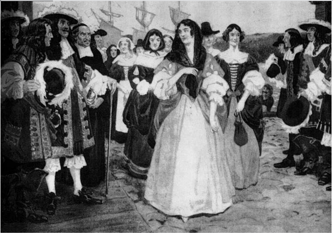
C.W. Jefferys, aquarelle. Débarquement des Filles du Roy à Québec.