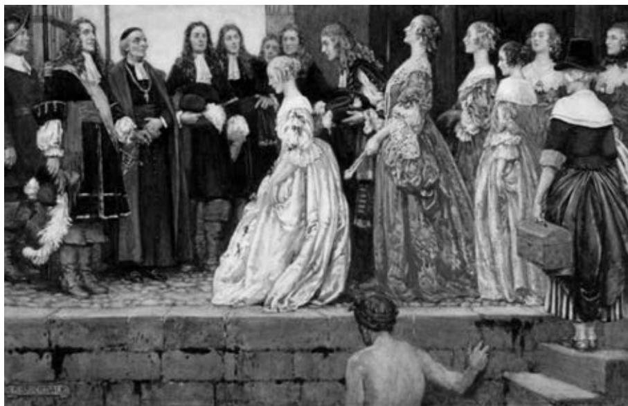
Aquarelle réalisée par Eleanor Fortescue Brickdale représentant des Filles du roi. (Bibliothèque et Archives Canada/C-020126).

Entre 1900 et 1995, le tiers des romans historiques québécois prennent place en Nouvelle-France et l'engouement pour cette période ne s'est pas démenti depuis. Si les romanciers s'appuient généralement sur l'historiographie pour documenter leur récit, on observe un décalage plus ou moins important entre les faits mis en fiction et les recherches récentes sur le sujet. Jusqu'à récemment, les Filles du roi étaient souvent relé-