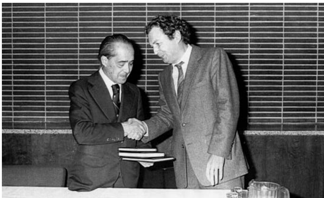
(Fonds Jean-Charles Falardeau. Archives de l'Université Laval).