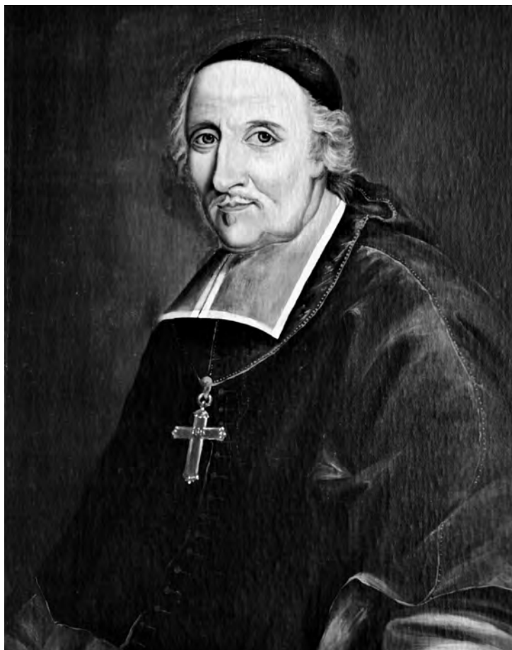
M gr François de Laval, devenu saint François de Laval le 13 avril 2014, l'année où sa paroisse, Notre-Dame de Québec, célèbre son 350 e anniversaire.

En son bien modeste Séminaire de Québec, le 15 septembre 1664, M gr François de Laval, évêque in partibus de Pétrée et « vicaire apostolique pour le royaume du Canada dans l'Amérique septentrionale », signe le décret d'érection de la paroisse de Québec sous le titre de l'Immaculée Conception de la Bienheureuse Vierge Marie. En dédiant la paroisse à Marie, M gr de Laval s'inscrit ainsi dans la continuité du fondateur de Québec, Samuel de Champlain, qui avait fait construire l'église Notre-Dame-de-la-Recouvrance, en 1633, et des Jésuites qui avaient inauguré l'église Notre-Dame-de-la-Paix, en 1650. Et c'est cette dernière église (sur le site de l'actuelle basilique-cathédrale Notre-Dame de Québec) qu'avait trouvée M gr de Laval à son arrivée à Québec, en 1659, et dans laquelle il célébrait depuis lors. Dans cette ville de Québec qui compte environ 70 mai-