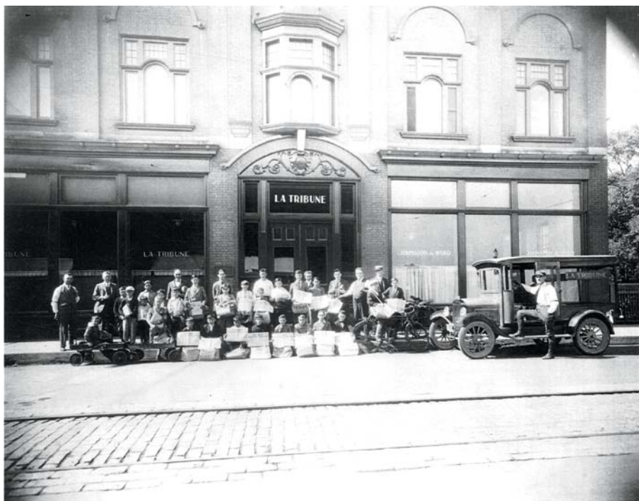
Groupe d'employés du journal La Tribune, devant le Art Building, 1928.