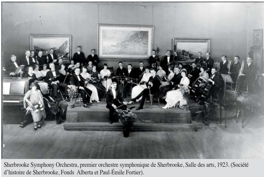
Sherbrooke Symphony Orchestra, premier orchestre symphonique de Sherbrooke, Salle des arts, 1923.