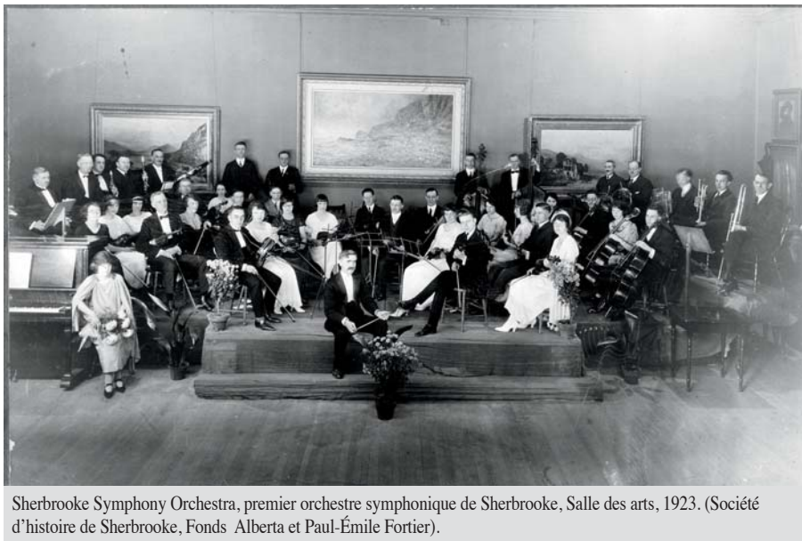
Sherbrooke Symphony Orchestra, premier orchestre symphonique de Sherbrooke, Salle des arts, 1923.