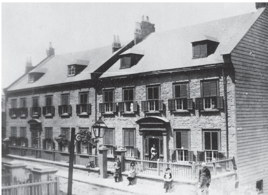
Le premier hôpital Jeffery Hale, rue Saint-Olivier.

Dans le deuxième tiers du XIX e siècle, les structures institutionnelles au Québec se scindent selon la langue et la religion. Les écoles bilingues et non confessionnelles fondées au début du siècle disparaissent et le système d'éducation public se