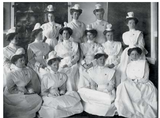
Classe d'infirmières de 1911 à l'hôpital Jeffery Hale. Entre 1901 et 1970, l'hôpital gère la première école des sciences infirmières à Québec. 1 285 infirmières y obtiennent leur diplôme.

l'offre en anglais au Jeffery Hale. En 1982, le gouvernement ordonne la fermeture des services d'urgence et de pédiatrie à l'hôpital. Les anglophones se mobilisent, une pétition est lancée et le gouvernement revient sur sa décision. Dans les années 1990, la Régie régionale de la santé décide de transformer le Jeffery Hale en centre de soins de longue durée. Les anglophones se mobilisent encore et certains services hospitaliers sont maintenus, notamment les services d'urgence, mais la chirurgie et l'obstétrique sont abandonnées. En 2000, on tente encore de faire disparaître le Jeffery Hale à travers un énième projet de consolidation régionale. La communauté anglophone négocie plutôt en vue d'une consolidation des institutions sur une base linguistique. Les institutions anglophones de santé et de services sociaux à Québec sont regroupées, dont le Saint Brigid's Home fondé par les Irlandais, en 1856. Une minorité infime d'irlando-catholiques n'aime pas l'idée de fusion avec les « protestants », mais la majorité des