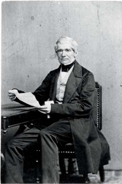
Jeffery Hale.

système scolaire, crée des associations, prend en charge la charité et s'immisce dans la presse. Cela se produit tant au Québec qu'à l'international en raison de l'ultramontanisme, nouvelle tendance conservatrice au sein de l'Église. Il y a un parallèle du côté protestant avec la montée de l'évangélisme et les revivals , qui redynamisent la pratique et l'identité religieuse. Tandis que le catholicisme devient plus contrôlant, l'évangélisme protestant s'en prend aux hiérarchies, des tendances opposées qui accentuent les frictions.