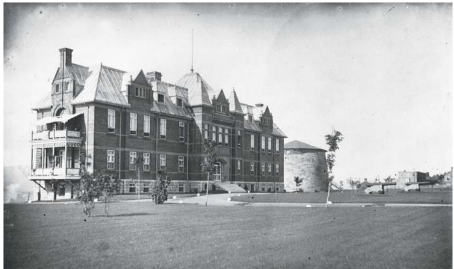
Le deuxième hôpital Jeffery Hale en 1904, peu avant la démolition de la tour Martello 3 pour construire le McKenzie Memorial Building. (BAHQ-Québec, Fonds Fred C. Würtele, P546, D3, P31).

Le Jeffery Hale croît rapidement. Des ailes pour contagieux et pour enfants sont ajoutées. Avec la fermeture de l'Hôpital de la Marine, en 1891, le Jeffery Hale reçoit les marins et les immigrants protestants. Vers la fin du siècle, les patients sont plutôt entassés. L'hôpital reçoit un don important lui permettant de déménager dans de nouveaux locaux.