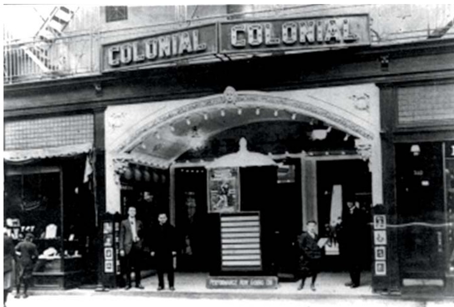
Le théâtre Colonial (1915), situé rue Sainte-Catherine Ouest, est un des vecteurs de diffusion de la culture américaine à travers son cinéma.

de Molière. Plus encore, Archambault présente en quelque sorte l'anglophone au francophone comme modèle. Parlant de la piètre qualité du français utilisé par les commerçants francophones, il se demande : « Que ferait un Anglais, si un Canadien-français [sic] essayait de placarder sur son magasin une affiche qui massacrerait ainsi sa langue (...) ? » Même le jeune prince de Galles, qui visite le Canada en 1919, est mis à profit, Archambault saluant la maîtrise du français du jeune aristocrate anglais. C'est donc surtout aux francophones eux-mêmes qu'Archambault s'attaque dans ses textes. Pour lui, ce sont d'abord et avant tout les industriels et les commerçants canadiens-français qui ont failli à la tâche. Cela dit, l'anglais – la langue, et non son locuteur – porte tout de même indirectement une partie de la faute. Pour Archambault, le comportement des élites économiques canadiennes-françaises s'explique par l'idée, trop répandue selon lui, que l'anglais est la seule et unique langue des affaires, que le français n'est pas une « langue commerciale ». En adoptant la langue anglaise pour identifier leurs entreprises et mener leurs affaires, les commerçants et industriels canadiens-français « fortifient à nos