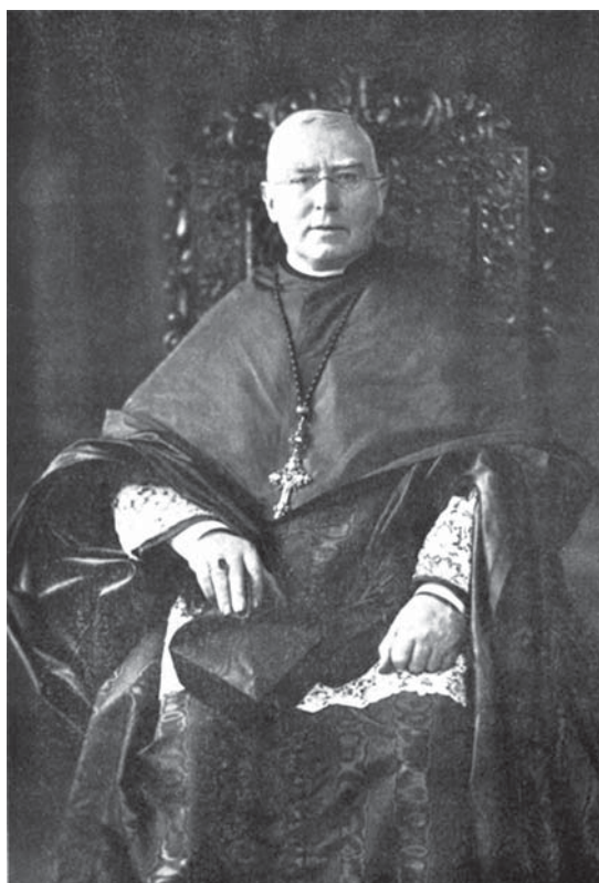
Francis Bourne (1861-1935), archevêque de Westminster, Angleterre. (wikipedia.org/wiki/Francis_Bourne#mediaviewer/File:CardinalBourne.jpg).

Majoritaire durant tout le deuxième tiers du XIX e siècle, l'importante communauté anglophone de la ville représente toujours plus du tiers de ses habitants au début du siècle suivant. Cette minorité est largement surreprésentée au sein de la grande bourgeoisie capitaliste.