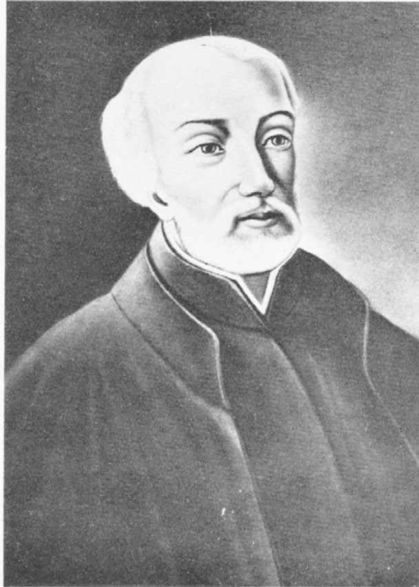
R. P. F.-X. de CHARLEVOIX, S. J.

Ses talents ne s'arrêtent pas là, car les mammifères et l'avifaune de l'Amérique du Nord sont traités par de splendides dessins au trait, cependant moins achevés que ses planches botaniques. On notera toutefois que certains animaux, comme