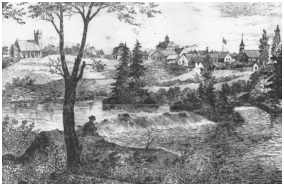
Le village de Drummondville, 1875, gravure. ( Canadian Illustrated News , 1876).

Profitant des facilités de flottage qu'offre la rivière Saint-François, les scieries Cooke et Vassal retiennent dans leurs estacades les billots de pin et d'épinette coupés sur les terres d'amont alors que la tannerie Shaw & Cassils se réserve les billots de pruche. Une agglomération, communément appelée « Village de la tannerie », naît dans le voisinage du moulin Cooke et de la tannerie, tous deux situés côte à côte sur la rive droite de la Saint-François. En 1880, la fonderie John McDougall construit deux hauts fourneaux pour fondre la limonite que l'on trouve en