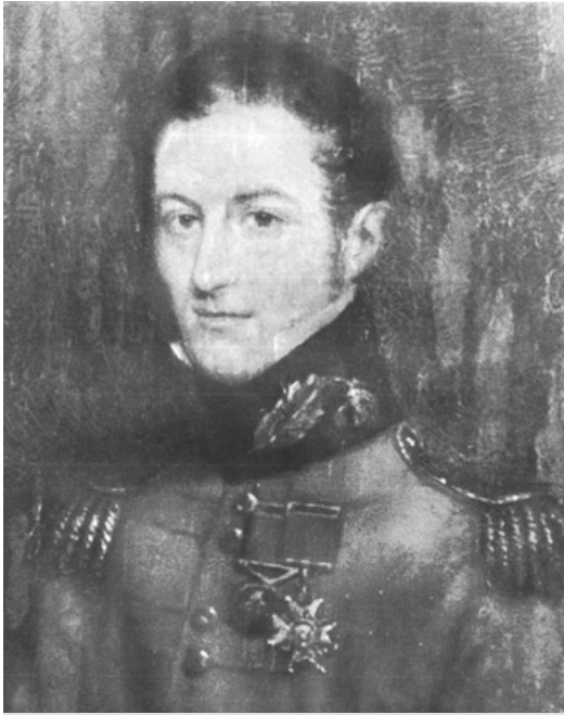
Frederick George Heriot (né à Jersey en 1786 - décédé à Drummondville en 1844), officier dans l'armée et la milice, juge de paix, fonctionnaire, propriétaire terrien, homme politique. ( http://www.biographi.ca/fr/bio/heriot_frederick_george_7F.html ).