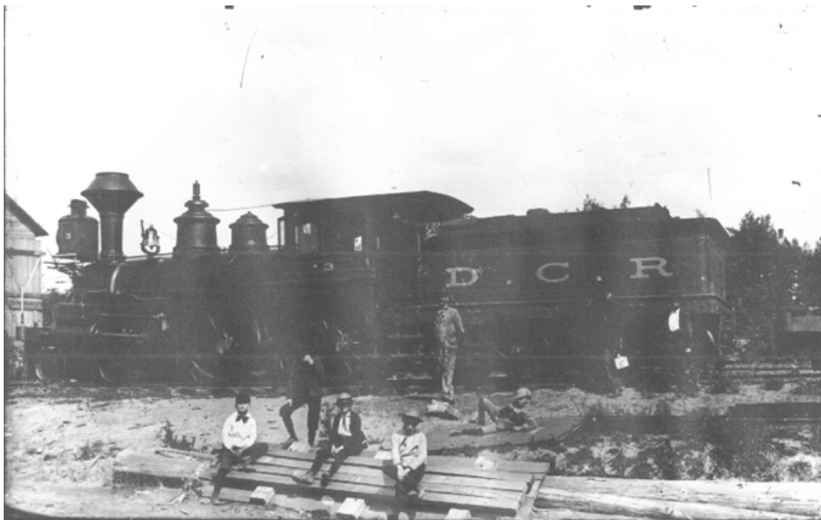
La locomotive n° 3 du Drummond County Railway. Photographie de Charles Howard Millar, vers 1895. Fonds Leslie Millar. Musée McCord.

de Québec. Les administrateurs ont pris la décision de construire leur réseau en partant de Drummondville, où étaient centrées leurs activités forestières. La première voie visait à leur donner un accès au fleuve Saint Laurent. Nicolet a été choisi comme terminus.