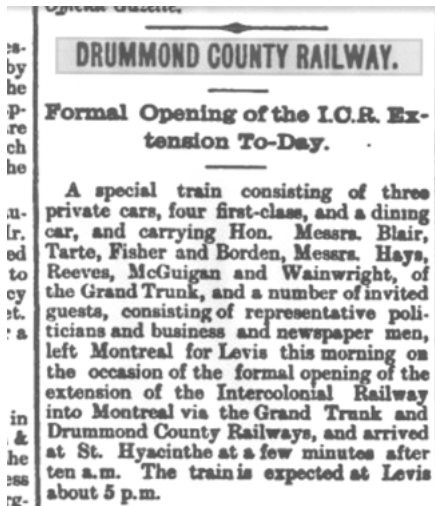
The Quebec Saturday Budget, le 30 octobre 1897.

encore plus grande. En effet, les propriétaires de compagnies ferroviaires québécoises n'investissaient des fonds dans leur propre entreprise qu'avec réticence. Une partie des actions attribuées aux administrateurs a probablement été offerte en échange de temps investi dans la gestion.