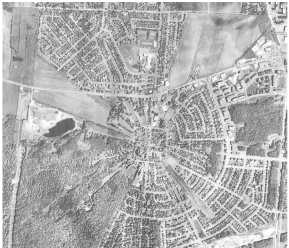
Le trait carré de Charlesbourg aujourd'hui.

et des petits commerces s'implantent à travers les maisons de ferme. L'église actuelle est construite en 1830 et le nouveau presbytère en 1875. Le couvent des