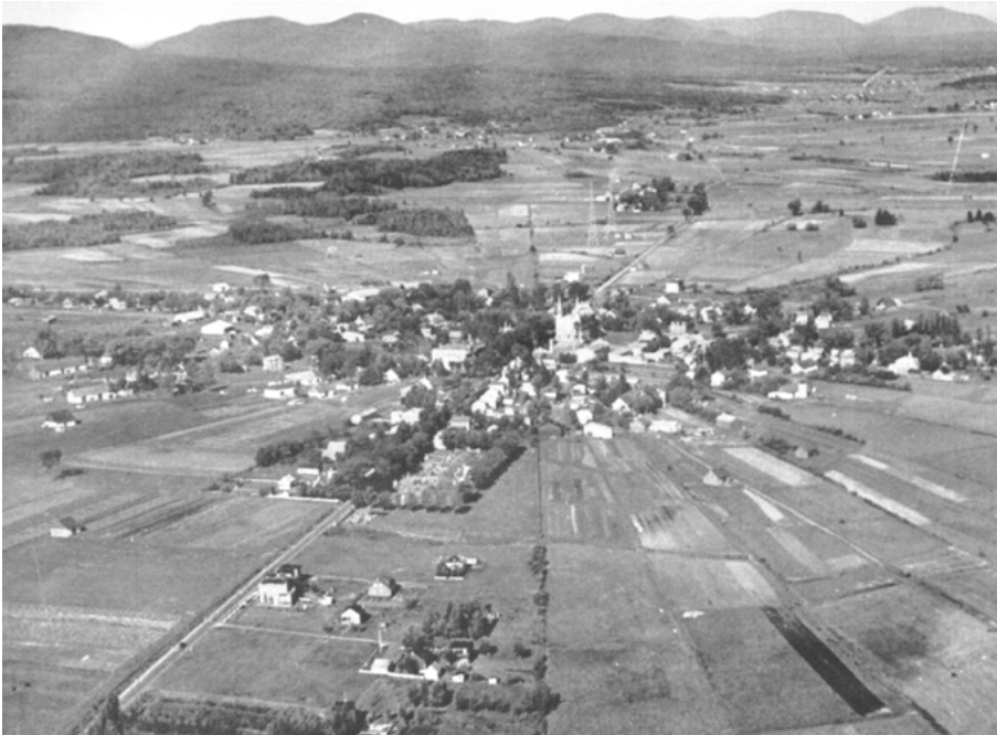
Le trait carré de Charlesbourg. Photographie Edward 1937 (Virtual museum.ca).

sœurs du Bon-Pasteur et le collège des Maristes sont érigés en 1883 et 1903, respectivement. Municipalité de village en 1914, Charlesbourg devient une cité en 1949. Malgré l'urbanisation de la seconde moitié du XX e siècle, le plan radial et le tracé de la commune restent bien visibles dans le paysage. Cet espace d'une grande richesse historique et culturelle est reconnu comme site patrimonial en 1965. Puis, en janvier 2002, Charlesbourg est fusionnée à la Ville de Québec et en devient un des arrondissements.