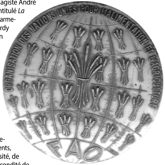
Revers de la médaille de la FAO. (Coll. de l'auteur).