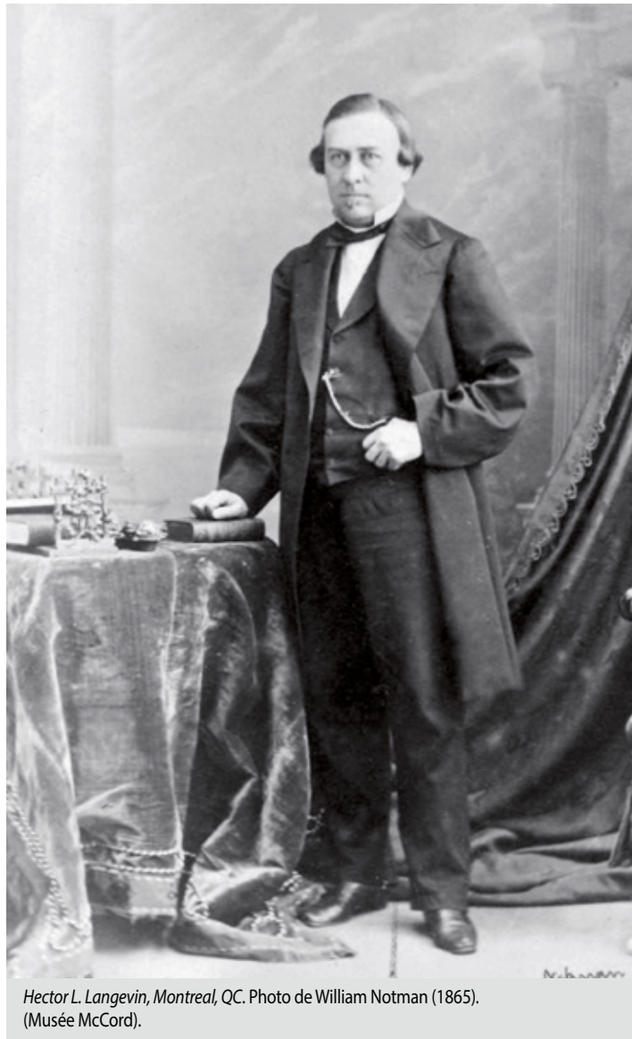
Hector L. Langevin, Montreal, QC.

à ce jour, quoique certains États unitaires puissent avoir des traits fédéraux ou être carrément en voie de fédéralisation, et quoique certains États fédéraux puissent être gouvernés comme s'ils étaient unitaires.