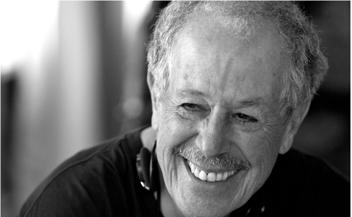
Denys Arcand

S i les Pierre Perrault, Michel Brault, Claude Jutra, Gilles Groulx et Jean-Claude Labrecque peuvent être considérés comme les pères fondateurs du cinéma québécois, Denys Arcand en est le grand frère de toutes les audaces. Il a ouvert la voie cinématographique qui a mené à Cannes et Hollywood toute une génération de jeunes cinéastes : Jean-Marc Vallée, Denis Villeneuve, Xavier Dolan. Le temps d'un repas au Musée national des beaux-arts du Québec, le cinéaste se dévoile avec générosité. Cochez oui. Cochez non.