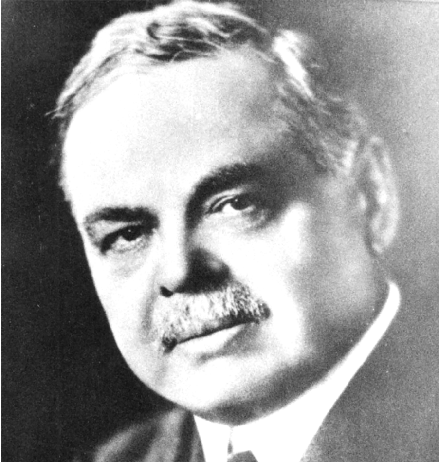
Lomer Gouin, premier ministre du Québec de 1905 à 1920.

nom de Ligue antialcoolique, on préconise soit la tempérance, soit une réglementation sévère, sinon des prohibitions locales, mais pas toujours la prohibition totale. Difficile de s'y retrouver!