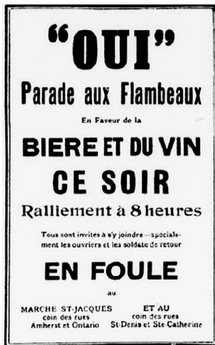
Affiche de la Parade des Oui avril 1919, La Presse ..

Organisée par le Conseil central des métiers et du travail de Montréal et par des associations de vétérans, on la qualifie de « parade des ouvriers ». Près de 10 000 ouvriers et soldats démobilisés participent : dans le contexte des grèves et des revendications de l'après-guerre, on veut donner un caractère tempérant et ouvrier au rassemblement.