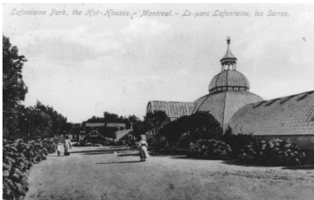
Les serres du parc Lafontaine. Carte postale vers 1910.