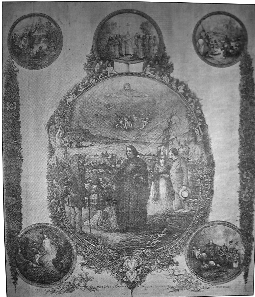
La Prédication apostolique dans les différentes parties du monde , 1874, lithographie reproduite dans La Presse , 28 octobre 1905, p. 5.