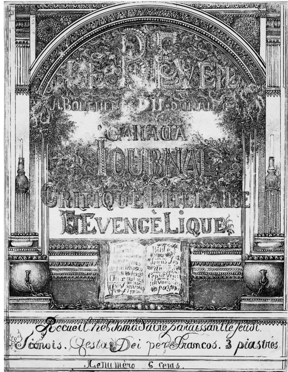
Le Réveil du Canada , non daté, lithographie, 22,8 x 17,4 cm, Rijksprentenkabinet, Rijksmuseum.

de Breslin en matière d'orthographe. L'encrage irrégulier de la pierre rend cette image encore plus difficile à lire. Les lettres du titre sont décorées et placées sur un fonds de feuillage très dense qui s'interrompt au niveau du mot Évangélique . Le tout est entouré d'un cadre formé de pilastres sur les côtés et d'un arc à la partie supérieure. Les pilastres, ornés de bougies placées sur des glands, reposent